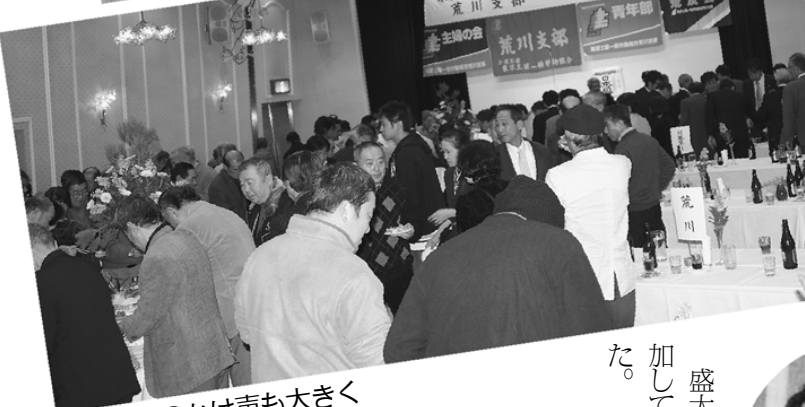
会場からのかけ声も大きく鏡割り(上)と参加者