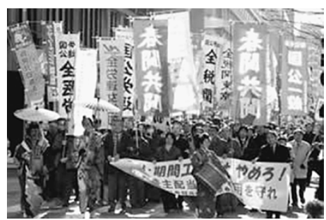
マスコミで大きく報道された経団連包囲行動

【機部正三通信員】荒川 1月14日、国民春闘共闘は労働者と中小零細業者の仕事と生活を守るため、日本経団連会館の包囲行動を行いました。全体の参加率は900人、東京土建荒川支部は5人が参加。初めに金融庁前で、「大銀行は貸し渋りと貸しはがしをやめて、中小零細の経営を守れ」と行動。続いて厚生労働省前の行動では、「派遣や期間工切りをやめろ」「労働者派遣法を抜本改正せよ」など要求を厚労省にぶつけました。最後は日本経団連前までデモ行進をして、経団連前で路上集会を行いました。「労働者の使い捨てを許すな」「最低時間給を1000円以上に引き上げよ」「金融危機のツケを労働者や中小零細企業に押しつけるな」「大企業は社会的責任をはたせ」「内定の取り