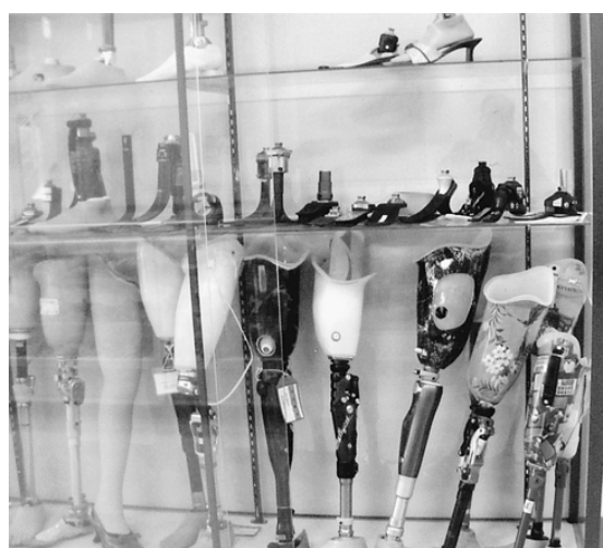
義肢製作のようす (右) と様々な義肢装具

特筆すべきは、手足を失い一度はスポーツをあきらめた人たちに大きな光明を与えていることです。センター内には、2008年に行われた北京パラリンピック女子バレーボール出場者の名前が入った額皿や09年に行われたノルディック・スキー選手権出場者の写真が展示されています。