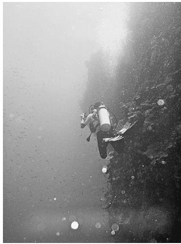
セブ島・モアルポアルで