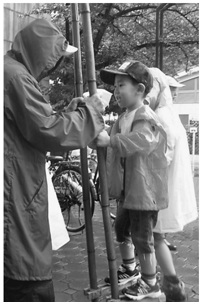
竹馬は大好評。西尾久分会