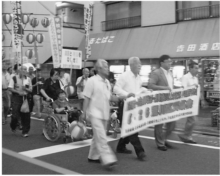
区役所前公園で氣勢をあげる参加者(上)と町屋までデモ行進の参加者

【小川隆志記者】南千住「梅雨の晴れ間の6月26日夕方、荒川区役所前公園で6・26荒川区民集会が開催されました。