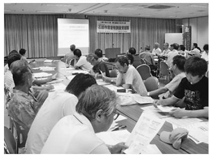
石綿補講のようす 6月25日、サンプール荒川