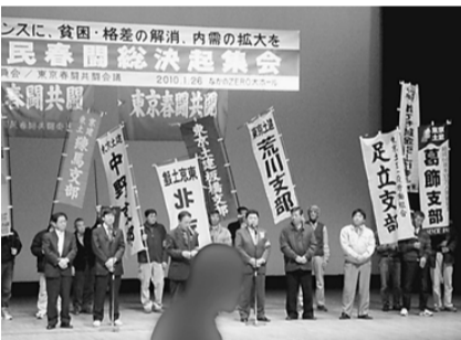
決意表明をする東京土建の仲間 中野ゼロホール

【小野澤富彦記者＝西尾久】1月26日夜、東京春闘共闘会議主催の「2010年国民春闘勝利! 1.26