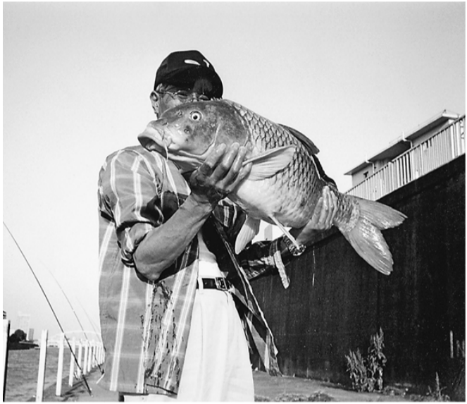
巨大な鯉をつり上げたAさん