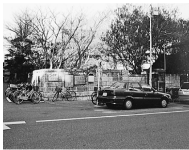
音無川は王子で石神井川からわかれていた。その清流は田端・日暮里・金杉を流れ、三ノ輪橋をくぐり、浄閑寺の西側にそって、ここから山谷掘をへて隅田川

でも楽しいものです。付加価値加工を認め、育ててきた文化があります。私どもの加工業は、機械化ができない手仕事で根気のいる作業です。多くの人に加工の美しさを見てもらいたいものです。村上さんは最近、2人の首相の招待状に金縁加工を行いました。