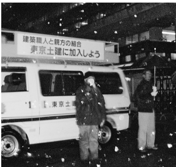
①税務署までデモ申告する3・13集会参加者②区労評春闘集会

庶民大増税をやめさせ、税金の使い道を正すためには国民全体の運動にして、政治の流れを変えなければならぬ。これから行われる都知事選・参院選で私たちの代表をきちっと選んでゆきましよう」と決意表明を受けました。参加者は、「大もうけ大企業への減税と庶民大増税・消費税増税をやめさせ、政治の