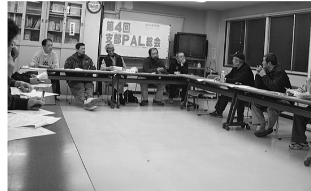
現場からの情報提供は重要だ＝PAL総会、支部会館

特徴点は、受注金額7億9840万円の東鉄工業施工のマンション現場では、①賃金水準は、型枠1万8千円、鉄筋1万5千円、左官1万7千円、とび1万9千円などで、30〜40歳代が多い。②産廃などの元請負担については、最初の取り決めで、リフト・クレーン料は徴収しないが、駐車代は各業者が負担している、といった回答を得られました。