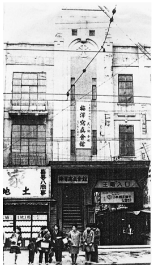
王電があった頃の三ノ輪橋(『王電・都電・荒川線』宮松丈夫著より)

子ども数が多かった80年代も学園祭などで大量販売でき、不動の人気を保ち続けていると思われましたが、90年代から採算が取れなくなりました。