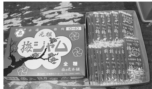
荒川から生まれた“元祖”梅ジャム

できた梅ジャムを売り込んだところ、駄菓子屋や紙芝居さんはおせんべいには喜んで売ってくれました。