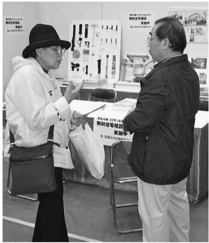
①②ともに住宅相談に応じる組合員（写真右側）＝荒川総合スポーツセンター