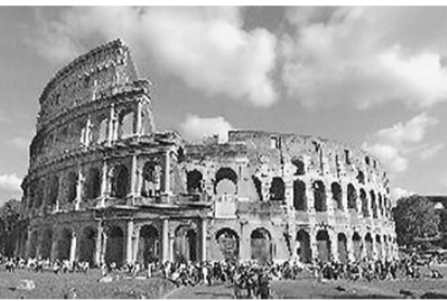
ローマ帝政期に建造されたコロッセウム(闘技場)

ローマは過去に直接手を触れることの出来る街。中世以来、ずっと変わらぬ時を刻み続ける異邦の地。すり減った石畳。はげかかった壁。過去の栄光を物語る遺跡が至る所に散在し、まるでタイムマシンで時をさかのぼって来たような、この不思議な空間。 その中に現代の建物があっても何一つ違和感のない、そんな街。 イタリアの手工芸品は、高い芸術性を誇り、生産に誇りを持っていない地域はない。生産技術の進歩は、各々の手工芸職人の対応で大きな違いをも