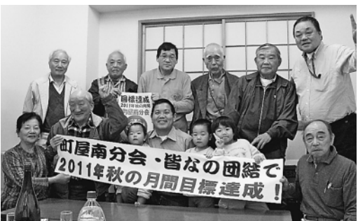
町屋南分会のみなさん。目標達成に笑顔、笑顔

神興建設の都営住宅の現場では、建退共は普及に努めているが、下請が請求をしないとの回答でした。