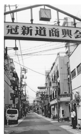
冠新道入口。商店街入口でもある

1915(大正4)年頃この辺り一体の地主だった冠権四郎氏が、所有地を開発のために開放したことによって開け、昭和初期にはすでに約30の商店が商売をしていたことが32(昭和7)年に出された冠新道周辺の地図で確認できる。昭和初期、四つの町会(同志会、昭和会、新交會、藍染會)を通り抜ける冠新道沿いに、桶屋、米屋、八百屋などから文