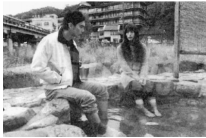
原作は、「スーパース」

© PAL ENTERTAINMENT'S PRODUCTION ALL Rights Reserved.