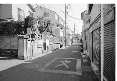
昔の面影を残す 荒川遊園通り