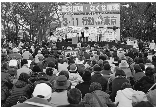
震災復興・放射能被害の防止・原発推進反対などがうったえられた東京集会＝井の頭公園、3月11日

東日本大震災と福島第一原発事故から一年となった3月11日、「震災復興・なくせ原発 3・11行動 in 東京」が、井の頭公園で開催されました。全体の参加者は8千人、東京土建荒川支部も参加しました。