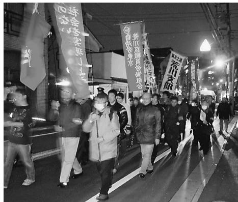
消費税増税反対などうったえデモ行進する春闘参加者