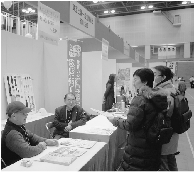
説明に思わず足を止める来場者＝土建のブースで

【磯部正三通信員】荒川区内の企業と技術を持ったマイスターが一堂に会する第33回荒川区産業展が3月10日、11日の2日間、荒川総合スポーツセンター内で開催されました。東京土建荒川支部も参加し、住宅リフォーム相談コーナーを設けました。荒川区を代表する企業とマイスターの展示物は、素晴らしいの一言につきま