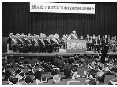
団結みなぎるハチマキ姿の参加者

来賓の各政党代表のあいさつがありました。続いて古市総連書記長の基調報告があり、各地域の建設労働者の賃金は東京が平均1万6千円、埼玉1万3千4百円などで、全国平均年収は219万円の数字が示されました。