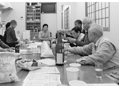
④出陣式の西尾久分会⑤アンケートの協力求める東尾久1分会⑥出陣式の町屋南分会