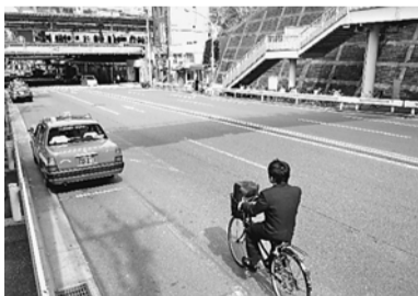
開成学園からみた道灌山通り

道灌は室町中期の武将で兵法に長じ、築城に才が長けていた。名は資長、俗に持資といったが、1458年には剃髪し、道灌と号した。道灌山通りの名称はその後につけられたと思われる。現在の通りは、道路位置も拡張されて1930年に竣工した。