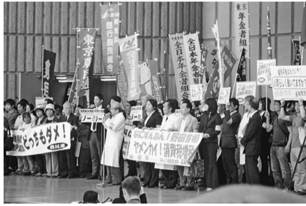
農民連など幅広い団体があつまった日比谷集会

【藤川直樹通信員＝東尾久】4月12日、日比谷野外音楽堂で消費税大増税ストップ4・12国民集会が開かれ、全国各地から5千人を超える人々が参加しました。荒川支部からも13人が参加し、永田町界隈をデモ