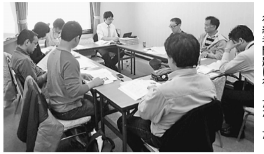
後継者問題は待ったなしだ