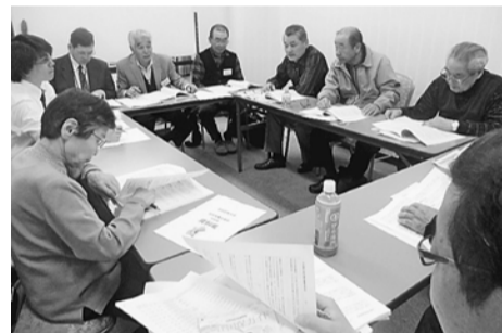
国保一元化などを論議した

薄井部長が報告、提案しました。学習会後に行う高齢者集会は良かった。要請ハガキの回収率が少ない分会へはさらに強めに呼びかけたいとの意見がありました。方針案論議では、持病を