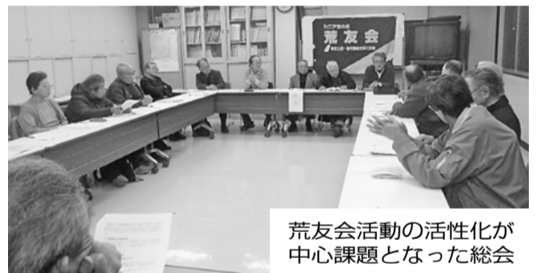
荒友会活動の活性化が中心課題となった総会