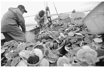
東通村ではホタテ漁もさかん

です。地形は平坦で標高の低い山が村内に点在し、東側の海岸付近にはいくつかの沼があり、多くの川が海に向かって流れています。