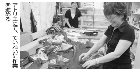
アトリエにて、ていねいに作業を進める

ンサイズの確認と装飾の取り付け位置など確認、④最終確認、挙式ギリギリでフアスナーをつけて完成！縫う人が接客するのが一番伝わります。デザインの打ち合わせから制作までを社長が対応しているの、細かい部分まで、納得が行くまで対応させていただいており、そこに力を入れています。普通オリジナルドレスの納期は一般的に3ヶ月から4ヶ月かかりますが、式場で気に入ったドレスが最後まで見つからず、最終的に駆け込んで来るお客様もいます。最短で一ヶ月半で対応もしています。