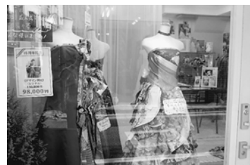
話題のドレスがシヨールタイム

この業界の大手は、ほとんど制作を中国等に委託しているのが現状です。オーダーとは本来手作りですが、既製品である程度できていて、一部直して「はい出来ました」となる事が多いと聞きます。また、ドレスの打ち合わせは担当者が受け、制作は別の担当者が行うので、細かい対応は無理です。エンジェルキッスのオーダーメイド制作ステップは、①デザイン打ち合わせと採寸(約20カ所ほど測る)、②仮縫いを着てデザイン・サイズの確認、③本縫いベースを着てデザイ