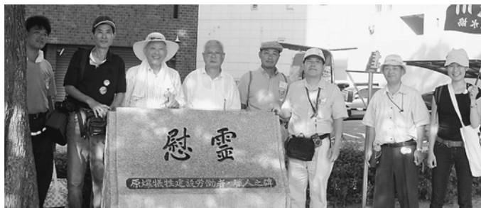
荒川支部からは7人が参加しました

福島共済病院でゲームーナジャーをしながら被爆者の体験を聞いたり被爆者手帳の手続きなどやっていると、被団協でも同じことをして、戦争の悲惨さを後世に知ってもらうために語り手になったと言った。被爆者たちの聞き取りをして継承していく今現在は「し