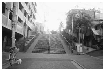
谷中銀座より見上げる

普通の路面店での販売が難しい時代で、結婚雑誌などに掲載したりして、広範囲からの集客を狙う、また納品したお客様より紹介を頂いたりして、繋がって来ています。いま、好評なド