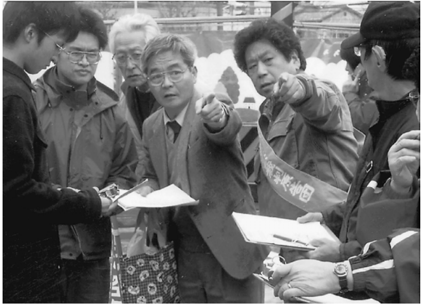
区民・学生たちと区内多数の地域で大気汚染調査を実施