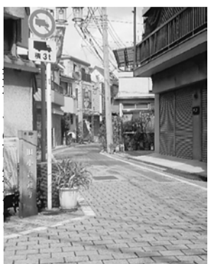
文・今野正夫記者 東尾久2、写真・並木義男記者 荒川

里にある道灌山遺跡は7千年前、夕焼けだんだん近くの延命院貝塚は4千年前のものです。