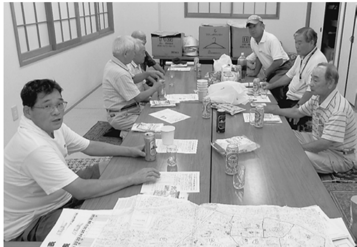
①東尾久1分会②手 前に広がるのは町内 の地図（町屋南）

【今野正夫記者＝東尾久 2】秋の拡大は2ヶ月で統 一行動日も多く、分会役員 も大変。組合員訪問をして も無関心な人もいて、結び つきが足りないと思うこと があります。役員と組合員 の拡大に対する温度差があ ります。