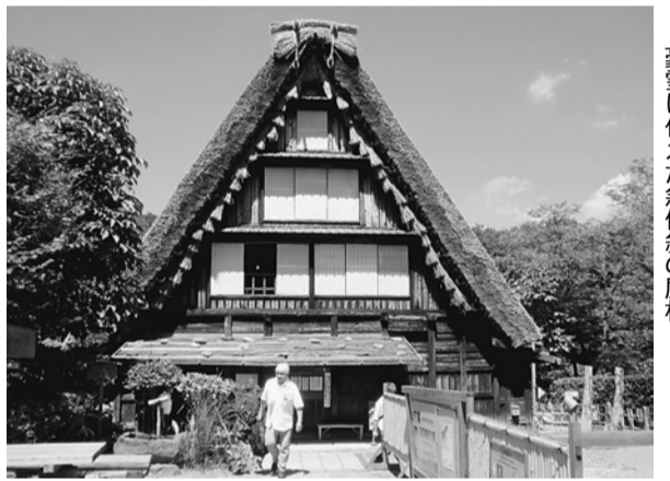
飛騨白川郷にあった合掌造りの住宅。豪雪に備えた急傾斜の屋根

懇親会。子育て世代の家族も多く「子どもが毎年楽しみにしている」「来年も是非」と好評でした