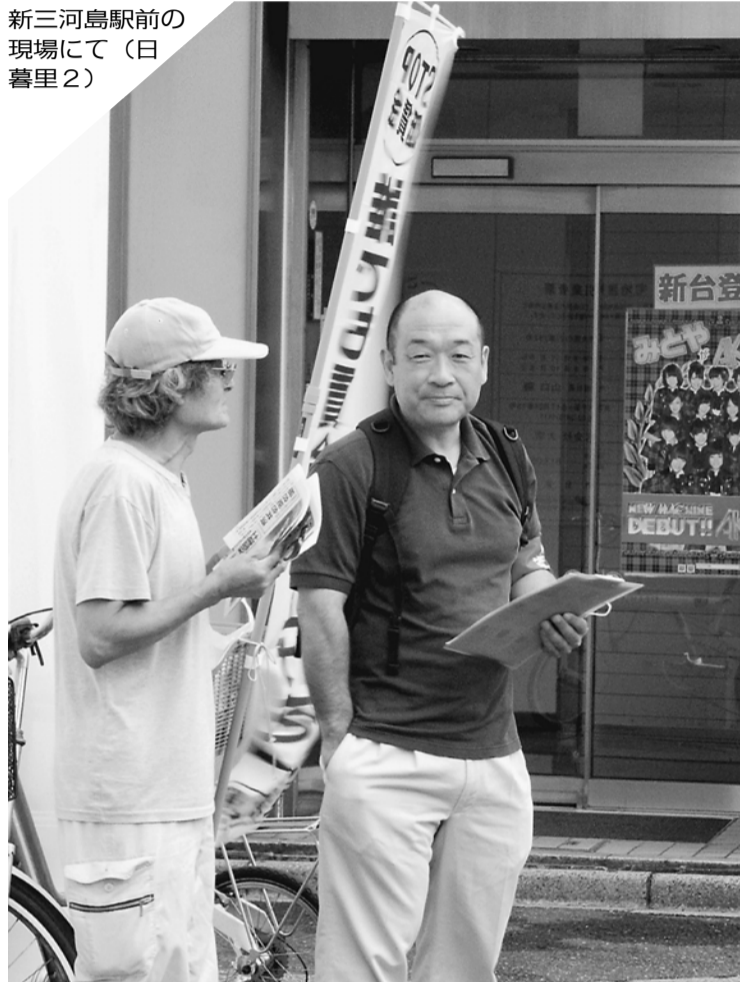
新三河島駅前の 現場にて(日 暮里2)