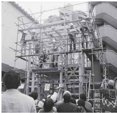
棟上げではお祭りがまかれ歓声があがりました

当日実施したアンケートでは「楽しかった、また参加したい」「子供に工場見学で製造行程を見ることができてよかった」と回答してくれ、嬉しかったです。