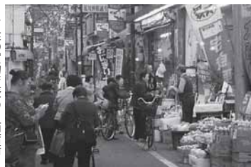
夕食の買物の賑わう商店街

クラリーノランドセル「妖精の翼」 ■26,000円 (←通常価格57,750円) ■22,000円 (←通常価格47,250円) ※詳細は支部へ。 申込み期間：2013年2月末