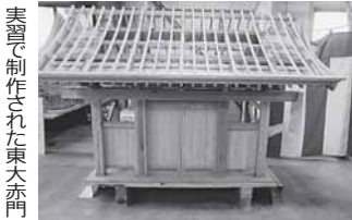
実習で制作された東大宮