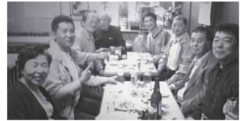
おつかれさまと乾杯をする、東尾久1分会