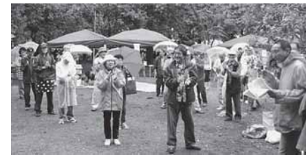
雨二モ負ケズ開会です

【機部正三通信員】10月23日、秋の賃金行動として、区内現場訪問を行いました。午前中は支部会館で行動概要と要求項目の打合せをし、午後から訪問行動となります。