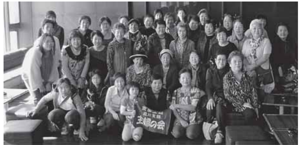
しょうゆ工場にて記念撮影。バスハイク参加のみなさん