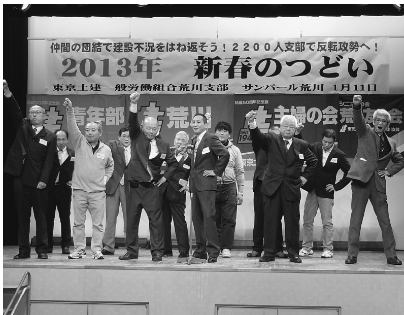
今年も皆で団結して、ガンバロー