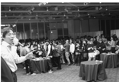
にぎやかで、楽しいひと時に

なので、料理を各自がお皿に盛ってきて楽しく、飲んだり食べたりしました。そして、余興の江戸太神楽が始まると、カメラを持っている人は前に出て写真を撮っていました。見るだけでなく、観客も参加できましたので、よけいに楽しめました。この日の一番の楽しみはビンゴゲームで、皆真剣に自分の番号に注目していました。当たった人は景品をもらって、恵比寿顔になっていました。そして、宴も終わりの時間となり、支部役員が壇上に上がり「団結、ガンバロー」で閉会となりました。