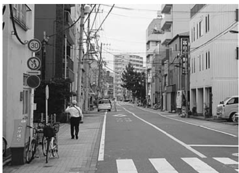
のどかでのんびりした通り

戦前からある通りで、この辺りは家が建て込んでいて、運送屋(当時は馬車屋)が多くあった。そのためこの通りには、戦前からある通りで、のどかでのんびりした通りの面影は無くなくなっているものの、のどかな通りです。