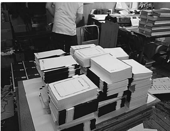
出来上がった大学ノートは梱包されて出荷に

の繁忙期。寮も準備して、仕事も工場に出勤し、夜は毎日夜中12時まで働いたそうです。仕事量も、やりきれない程にあったとの事。出稼ぎの人は、仕事が一前に出