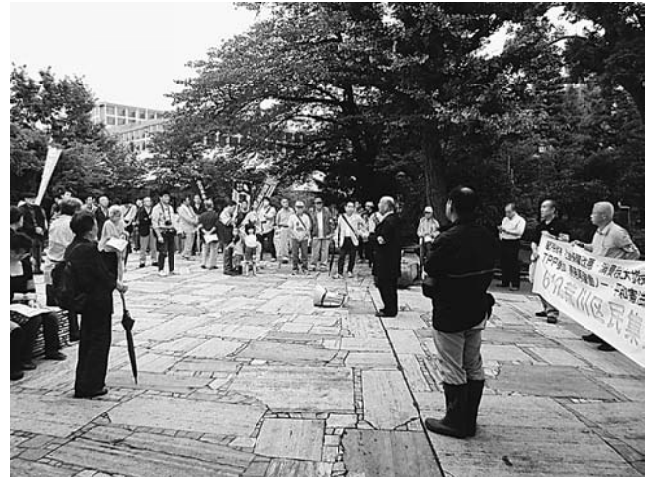
司会の説明に耳を傾ける参加者たち