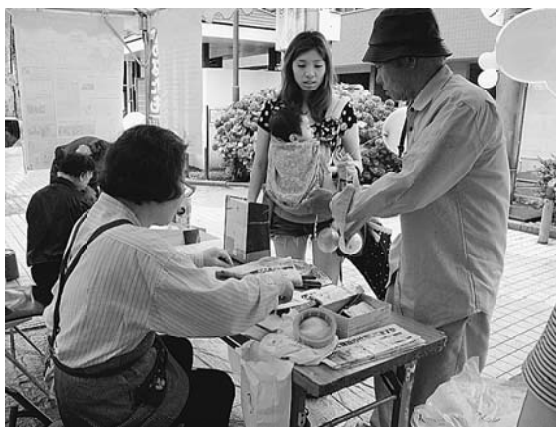
「ヨ-ヨ-と風船はお土産だよ」(南千住)

は5人も準備して待っているながらも、なかなか包丁の持ち込みがありませんでした。従って、研ぎ手の人達は少し作業をしては休憩している感じで、拍子抜けの感がありました。