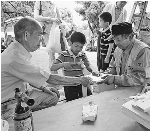
「うまくできるかな？」(西尾久)

発行所 東京土建一般労働組合荒川支部 東京都荒川区荒川6-3-1 TEL(3892)9131 FAX(3892)9381 発行者・豊田佳二/編集長・川又好一 http://www.doken-arakawa.org/