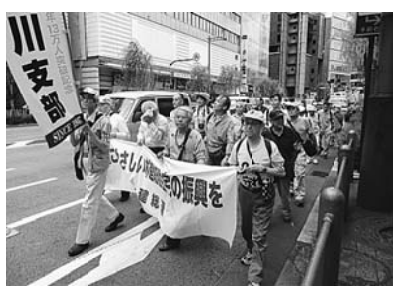
暑すぎず、デモ日和でした

谷公会堂にて、野音の集会の様子を同時中継したものをスクリーンで見ながら、集会に参加しました。参加した仲間は、いつもよりも集会に参加したという実感があると言っていました。また、屋内で快適だったことも良かったようです。集会終了後は、東京駅方面までデモ行進しました。支部からの参加は38人でした。