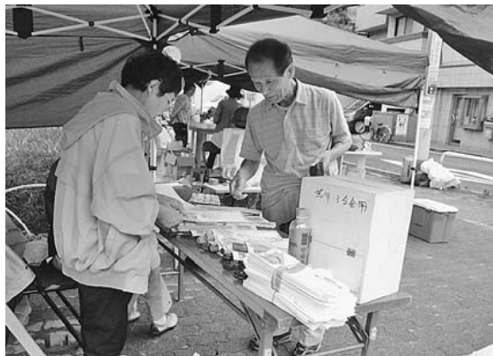
「毎年、ありがとうございます」(荒川)

【西尾久・小野澤富彦記者】会場は例年通り、荒川遊園入口で開催。雨の降る中で開始の10時を迎え、天気が悪いために午前中は当然ながら、来場者が少なかつたです。それでも、昼頃には雨もやみ、徐々に来場者も増えてきました。包丁研ぎやまな板削りと販売、住宅相談、木工教室に加えて、朝顔など花の小鉢販売