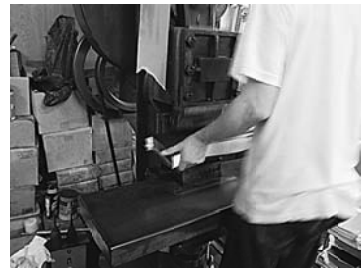
最後の仕上げ作業

二の坪通りから賑わい通りに入り、常磐線のガードへ曲がると「荒川製本所」という名前が工場入口にある。中に入ると「ゴン、ゴン、ゴン」という連続音とともに、出来あがった大学ノートが所狭しと積まれていく。