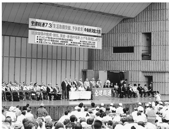
交渉団が厚労省と国交省へ交渉に

【編集部】7月3日、午前には都庁第二庁舎前で建設労働者対都要求行動が東京都連主催で行われました。交渉団が各都局と都議会の各政党へ交渉に行き、その間に庁舎前で参加者は、来年度建設国保の予算確保や諸要