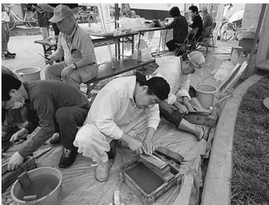
包丁研ぎの担当は大忙し(町屋南)

【荒川・間所秀夫通信員】心配された雨もたいしたことなく、焼きそばや磯辺焼き、新鮮野菜と果物、スリッパの販売、バザーなど、一番喜ばれる包丁研ぎや住宅相談、子供遊びと多彩な催しがあり、雨がやむと大賑わいでした。販売した食べ物関係は完売しましたが、梅雨時のイベント