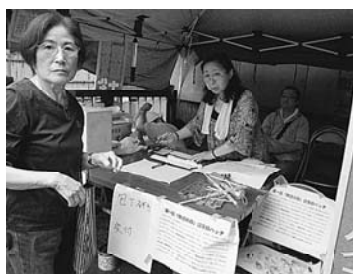
雨でも忙しく(日暮里一)

【南千住・根本武義記者】例年同様に、南千住通り児童遊園とジョイフル三ノ輪にある瑞光公園の2会場で実施しました。前日からの雨が午前中いっぱい降ったためか、会場への人の出足が思った以上に悪く、包丁研ぎの研ぎ手の係