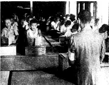
温泉旅館での授業

昭和16年12月8日、日本軍はアメリカ軍のハワイ真珠湾基地を奇襲攻撃し、アメリカ軍とその国際連合軍を相手に宣戦布告しました。私が、まだ板橋第一国民小学校一年生で、6歳の時のことでした。当時は、健康な身体で20歳から40歳の男子は検査を受けて、合格したら軍隊に入りました。同級生の父親は昭和17年9月に、出征した南方方面の戦いで戦死し、わずか32歳の若さで亡くなりました。私が2年生の時のことで、同級生の父親のお葬式には軍服を着た人が大勢参列していました。私も子供心に、同級生をはじめ遺族の人達の悲しみ、流す涙を