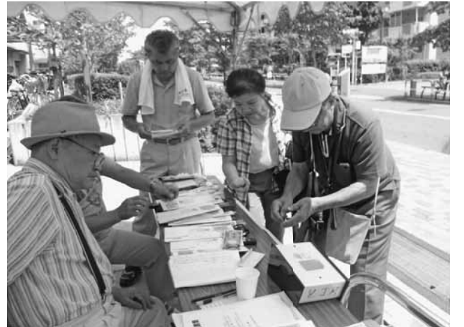
包丁研ぎが大変、盛況でした

【南千住・根本武義記者】7月21日、南千住分会は汐入にある相原宅の居酒屋「とうちゃん」前で今年も住宅デーを行いました。当日は、準備で作業スペースのシートを広げて敷いたり、テントを組んでいる