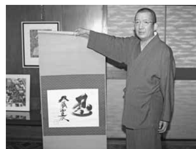
双葉山の書いた掛け軸を手に

JR日暮里駅南口から王子街道を線路に沿って上野方面へ歩いて行くと芋坂の所に羽二重団子の店があり、その前に双葉山が眠る善性寺(ぜんじょうじ)があります。今年(2013)は昭和の大横綱双葉山の生誕100周年にあたります。そこで、お墓を訪ねて、望月兼雄(もちづき・けんゆう)住職から横綱双葉山とお