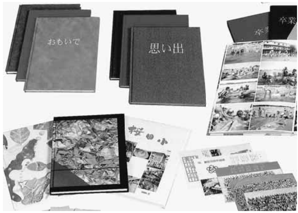
扱う製品は卒業アルバム、文集やカタログなど

人生でした。無一文になつて、初めて家族の大切さに気付かされるジョージ。選手時代に家族をな