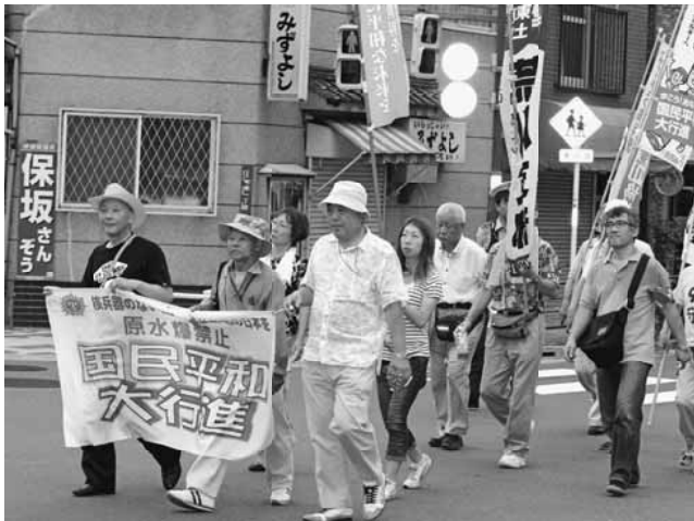
曇天で例年に比べ暑さもほどほどでした

分、区役所前の荒川公園に区内8団体から60人が集まりました。土建からは、31人の参加でした。原水爆禁止の横断幕を先頭に、区役所前の公園から台東区の花川戸公園まで約3・5キロを行進です。真夏の日差しを浴びて、のぼり旗やそれぞれの団体旗に願いを込めて、空まで届けと力いっぱい北海道から東京へ、そして広島や長崎へと全世界に確実に皆の平和への思いが広がっています。