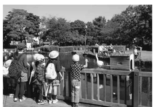
池にある水鳥小屋で白鳥がたたずむ

「自然公園」の名を冠していますが、東京都下水道局の三河島水再生センターの上を利用して設けられた公園で、人工の地盤上に水と緑が豊かに広がる荒川区の公園施設です。 荒川自然公園は、昭和49年に一部開園し、平成7年に現在の姿となりました。園内は2つのブロック