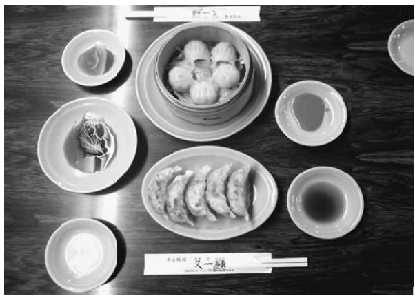
美味しい定番メニューの点心