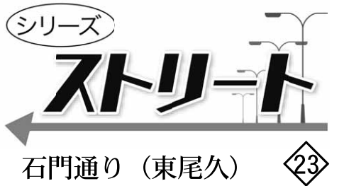
石門通り (東尾久) 23

石門通りは東尾久6、26先が起点で、終点の東尾久6-34先までの延長約345メートルのわずかな距離である。都電通りから旭電化通り(北豊島学園)まで続く道で、昔は上尾久と下尾久の境の道だったらしい。尾久の原公園の前の通りにある、東尾久6丁目の信号を都電方向に曲がると「石門通り」となり、その通りの中間に商