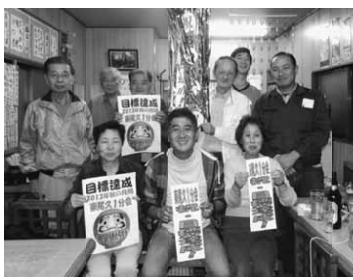
一番の笑顔 (東尾久1)