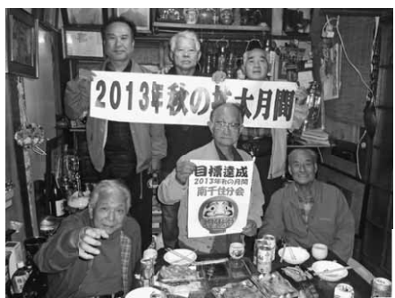
とにかく訪問が合言葉 (南千住)

果敢に組合内外の事業所訪問を続けるも、なかなか加入まで至らず、コンビ二前や現場前宣伝では他分会や他支部の仲間と会って励まされることもありました。また、ベテラン組合員を中心に、行動日以外でもボスティングや組合員訪問をコツコツ重ね、日曜行動後の