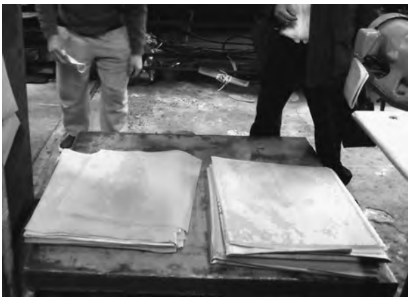
自社独自技術の特殊ゴム

原材料は、大判の板状ゴムやウレタン、樹脂シートや皮革などです。大判状の板をスライスして合わせ、バフ掛けし、裁断するというのが