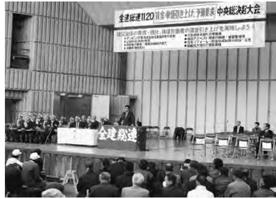
連帯の挨拶に立つ大門参院議員