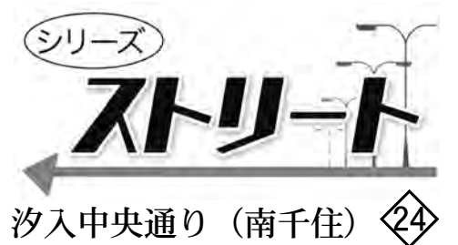
汐入中央通り（南千住）