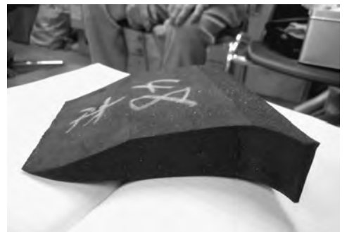
少ロット加工製品の一部

1丁目に引越した昭和44年の事です。会社名については、幾度もの七転び八起きの変遷を経たので、その「八起き」をとって、先代である父が「ヤオキ産業」と命名しました。