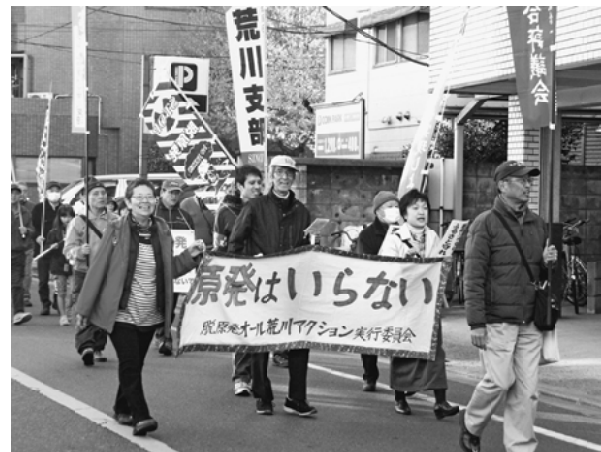
「原発はいらない」と訴えながら行進

業でも人が通る道や民家、山森は手付かずで、これで除染をしたのかと言っています。私は、子を持つ母親として、とてもたまり