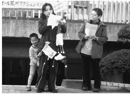
子を持つ母親の立場で訴える

【日暮里一・堀井龍二通信員】12月1日、晴天の日曜日に脱原発オール荒川アクションとして取り組まれた「脱原発荒川区民集会」