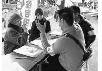
まかせて安心地元の職人

来場者からは、「毎年、包丁研ぎをはじめ、このイベントを大変楽しみにしている」との声も寄せられています。事前に今年の開催日程について問い合わせが、合わせが、るほど、地域住民の認知度は確実に高まっています。