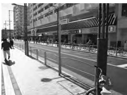
広い歩道で整備されている

時代が変わると環境も変わるの世の常であるが、この南千住8丁目、通称汐入地域はその芽えたるもの。汐入中央通りも都市再開発によって生まれ南千住8丁目6、17までの南北に570メートル程度の通りで、北は隅田川のスーパー堤防から始まり、最南端は都立産業技術高専キャンパスとしおひり保育園の交差点まで。