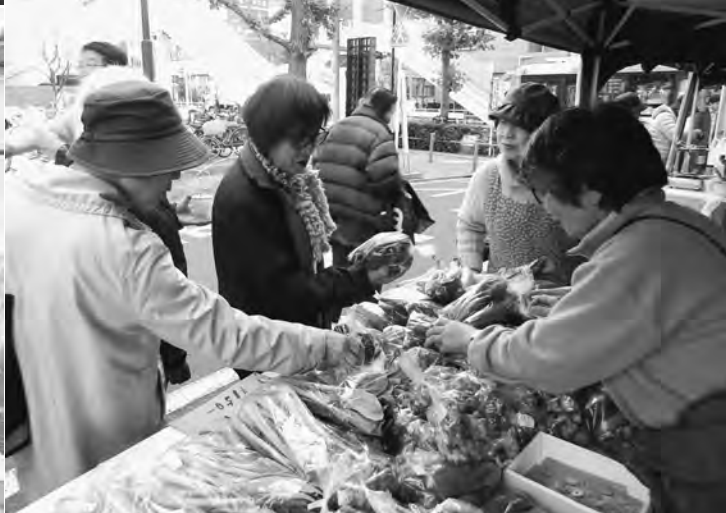
今年もお忙しの包丁研ぎ(左上) / 「どれにしようかな」(右上) 「わたアメ作りって楽しいね!」(左下) / 早々に完売した新鮮野菜の販売(右下)