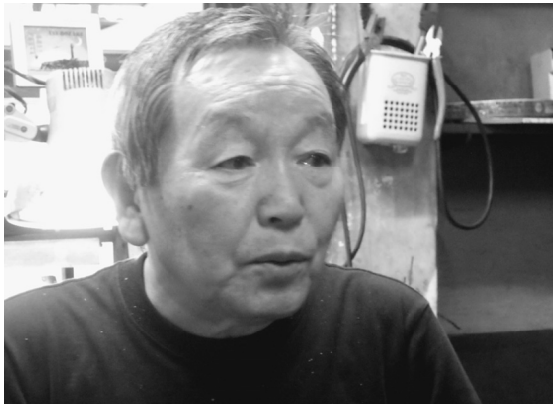
細かい作業のため目が疲れると話す

部品から出来ていて、微妙な円形と立ち上がりで、各部品を接続する穴を開け、そこに1000分の一の誤差も生じさせないで重ねて、かきめる技術は超一流です。そして、繊細な作業に使用する道具の糸鋸は0番を用いて、大変器用に使いこなしています。