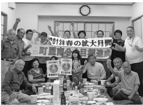
毎日多勢集まった町屋南分会

組合加入のきっかけとしては、組合員のつながりによる加入者が55人と、全体の約85%を占めました。組合員拡大で頼みとするところは、やはり組合員であることが今年月間でも実証されたこととなります。月間の序盤戦は、組合内事業所からの雇用日加入が相次いだこともあって、順調な滑り出しでした。しかし、第3次行動以降目標から離され、これを打開することができないまま、終盤の第5次行動に突入するという極めて苦しい戦いを強いられました。