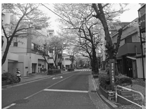
桜の咲く頃はまさに名前の通り

短い距離の桜並木ですが、3月下旬から4月上旬まで桜の見頃となります。周辺の区立児童遊園や高層マンションの田端スカイハイツ前も通りと同様にみごとな桜の花を咲かせます。