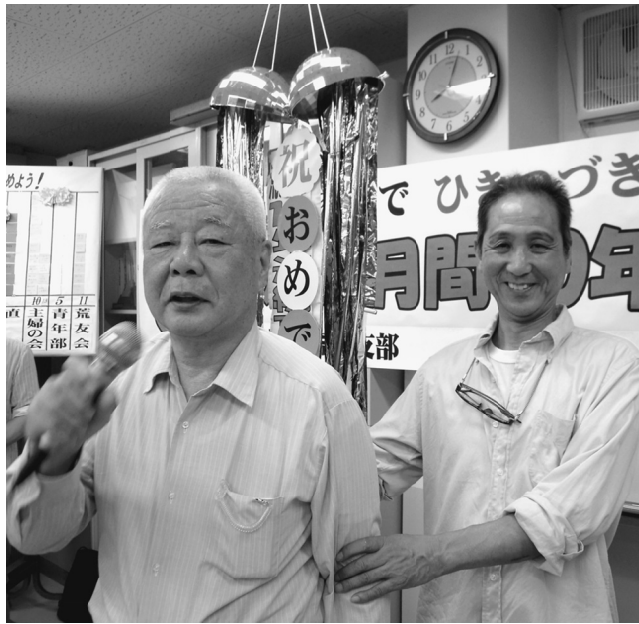
苦勞した月間でした、皆さんお疲れさま！

発行所 東京土建一般労働組合荒川支部 東京都荒川区荒川6-3-1 TEL(3892)9131 FAX(3892)9381 発行者・豊田佳二/編集長・川又好一 http://www.doken-arakawa.org/