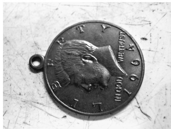
人気のあった装飾メダルのアクセサリ

昔は人の縁が仕事に繋がった 岩井製作所に10年勤務して、昭和50年に独立し、現在このようにあるのもプレス屋をしていたおじさんのおかげだと言います。おじさんのお得意さんや知人を紹介してもらい、順調に仕事がまわっていました。 当初は、ネクタイピンとカフスボタン、タイタックが製作の主流でしたが、現在では女性の装身具にと変わ