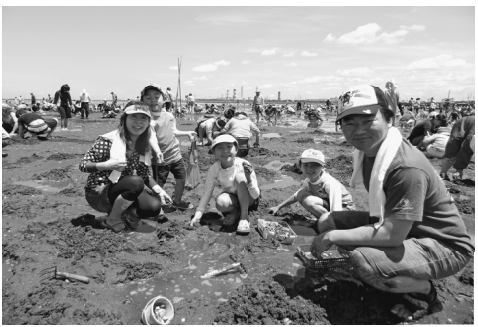
家族の笑顔が一番の収穫です

【荒川・五箇谷日出雄通信員】毎年恒例の後継者対策部主催のレクリエーション、潮干狩りを5月12日に行いました。