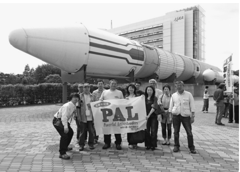
いざ、宇宙ロマンへ

【西尾久・増山國吉通信員】5月19日、東部ブロックのPALの会による第4回レクリエーションがありました。今回は茨城方面というところで、午前には牛久大仏を見学し、その後買い物を経て、昼食でブロック全体が集合してシャトーカミヤにてバーベキューで交流し、最後に筑波宇宙センターの見学という内容でした。