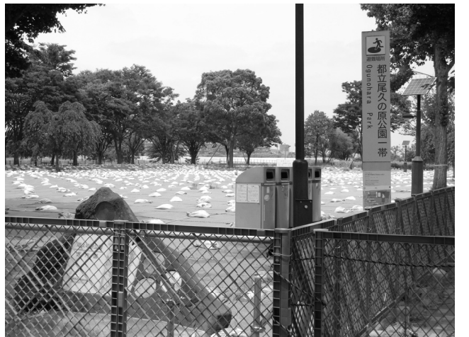
不安を解消し、安全な状態で早期全面解放を

ダイオキシン類について、尾久の原公園8カ所、多目的広場及び月極駐車場3ヶ所で、環境基準を超える結果が出ました。濃度は最大で6.2倍、平成17年に北区豊島5丁目団地で判