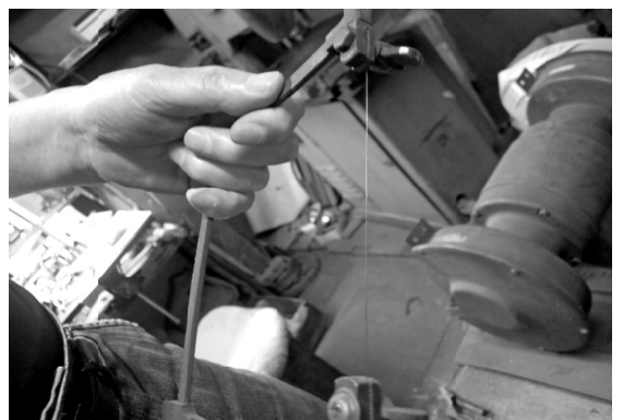
細い糸鋸のため使いこなすのが大変

術を磨いていたとのこと。工場では精密な医療器具などの製品も手掛け、社長やお得意さんの信頼も不動のものとなりました。 この間に茨城在住当時か