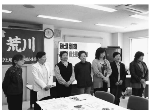
新年度役員メンバー

病については皆で学習し、大変良い企画で勉強になりました。今年荒川分会のバーベキューや荒川区産業展と重なるなどもあり、参加者が少なかったようでした。