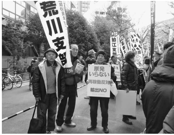
参加者が多くて会場外での集会参加に

【荒川・磯部 正三通信員】3月9日、東日本大震災から3年目を迎えるのを前にして、日比谷野外音楽堂や国会議事堂周辺で市民団体や個人らが集まって「原発ゼロ・大統一行動」と題した大規模な反原発の集会行動