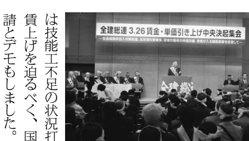
一丸となり賃金引き上げ要求

【日暮里一・堀井龍二通信員】3月26日、砂防会館で全建総連生活危機突破中央集会有り、参加してきました。集会では、国会議員による挨拶で公共工事の質の向上で消費の冷え込みを抑えたいと話がありました。また、岩手や兵庫県連の仲間の賃金引き上げの取り組み運動報告がありました。集会后、東京の仲間