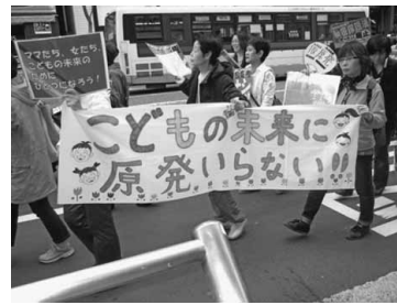
不安ばかりの原発は反対