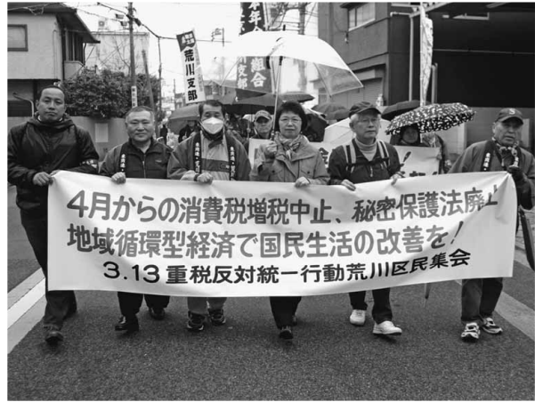
今回は雨の中でのデモ行進でした

の要請文を読み上げ、税務署の総務担当課長に文書を手渡しました。 申し入れ後に、参加者が6人ごとに確定申告書を提出して、流れ解散で終了。現場では、添付書類について組合の書記局にギリギリまで相談する人、「(参加者が)年々減ってるねえ」と寂しそうな