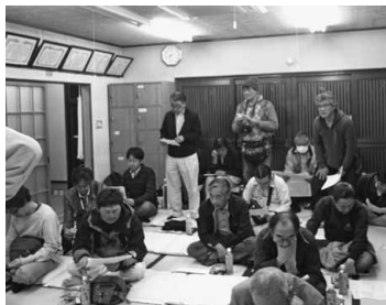
満場一致で新年度役員選出

分会総会議案に沿った昨年度取組み経過と会計報告に続き、新年度の方針と予算提案、新役員選出とスムーズに報告され、全員異議なしで、拍手を持って承認しました。