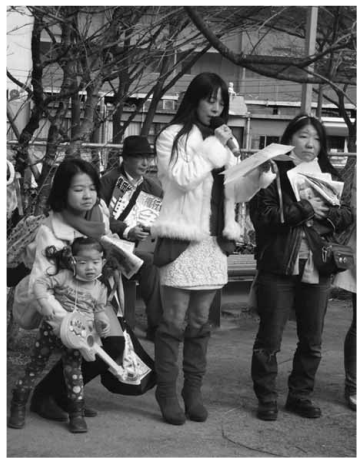
「ママたちが子どもを守る」

「子どもを守りたい」という思いが、一人一人の無関心が、愛に変わる事が大切で、母親たちは、世代を越えて友達になることが