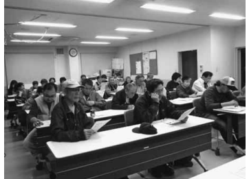
真剣に説明を聞く参加者

【荒川・並木義男記者】3月30日、支部4階で荒川分会総会が行われました。総会には全21群からのべ42人が出席し、報告と討議が