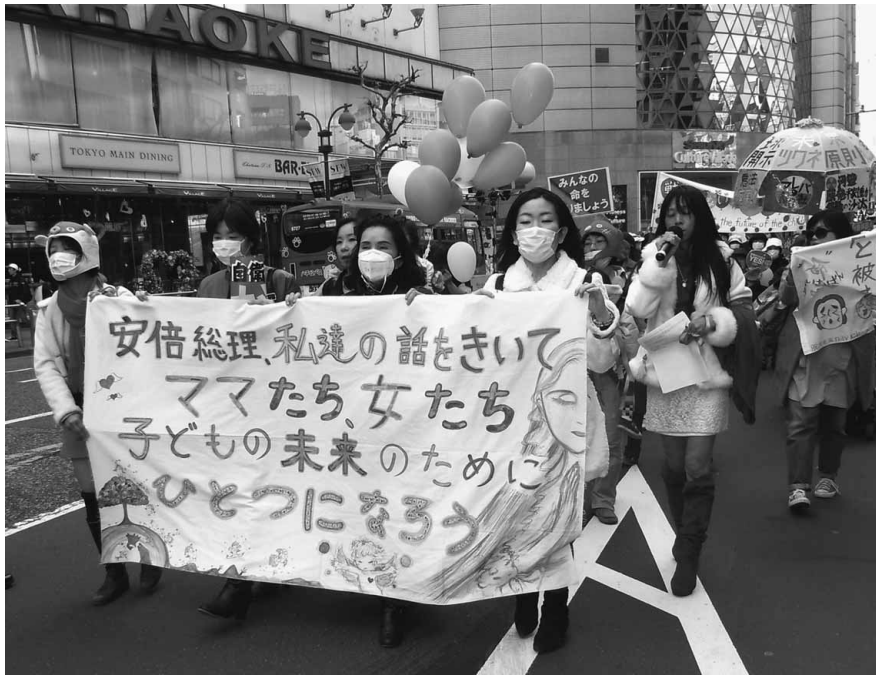
カラフルで手づくり感のある横断幕を先頭に風船等片手でデモ行進

横断幕を掲げて渋谷駅前や表参道を歩き、参加者の共通理念で主眼目的である子どもたちの幸福のために「子どもの未来を守りたい」と声を上げていました。参加者は主催者発表で約500人。取材 竹達浩記者/南千住分会