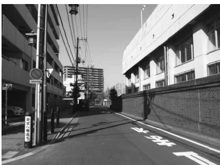
わずかな直線の短い通り