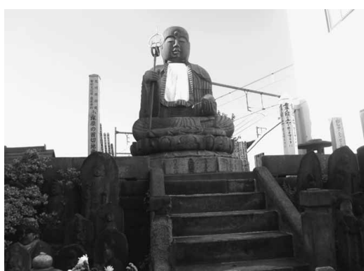
大きな石像坐身の首切り地藏

寺内にあります。明治初期に新政府によって刑場は廃止されましたが、創設から廃止までの間に合計で20万人以上の罪人がここで刑を執行されたと言います。