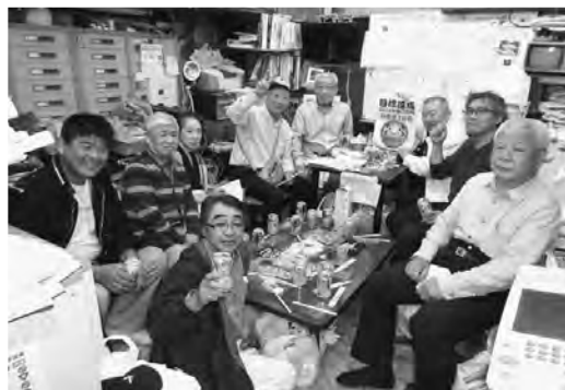
達成して安心の表情の面々(日暮里1)

これ、これでは達成は無理かと思っていたところ、未加入事業所の加入で何とか目標を達成することができました。今回の拡大月間では、特に組合員の仲間の協力と担当書記の粘り腰という諦めない気持ちが強かったことで結果に結びついたと思います。そして、支部長はじめ支部幹部役員を輩出している分会の底力を示せたので安心できました。