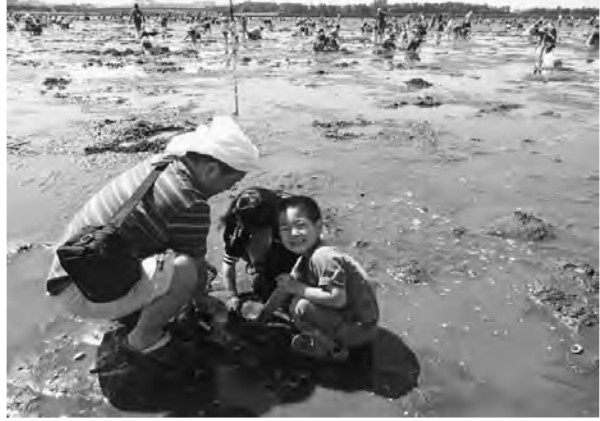
「どれどれ、アサリはいるかな」

【町屋南・井澤力通信員】5月11日、毎年恒例となった後継者対策部主催のレクリエーション、潮干狩りが行われました。