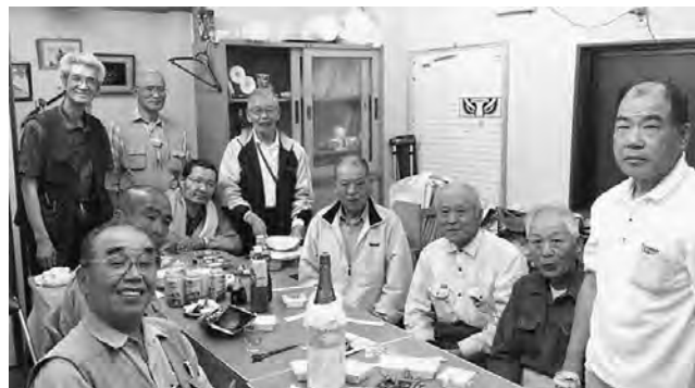
目標達成し、安堵の笑顔で祝杯(西尾久)

5月23日、最終行動日に拡大目標達成を分会拡大センターで祝いました。対象者がなかなか挙がらないなかで、よく頑張ったなと思えます。最初から最後まで苦戦を強い