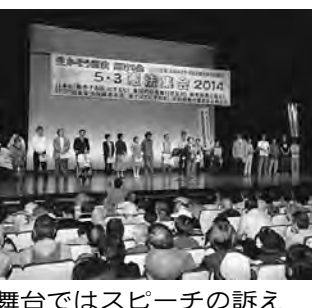
舞台ではスピーチの訴え