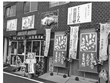
店舗の飾り付けで呼び込む

三代目の茂さんはアイデアマンでサーファー JR尾久駅を出て、明治通りを田端駅方向に進み、荒川七中入口信号を右手へ曲がり、突き当たりの線路沿いの道を左に進むと、色とりどりの目立つ商品案内のノボリがたつ、茶色いタイル壁のビルがあり、店頭幕の