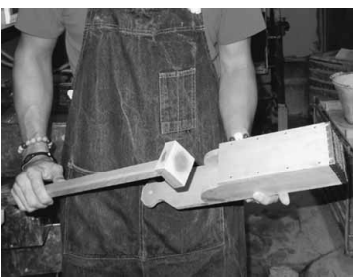
以前は家庭でも見かけました

実現せず、妻子には逃げられた上、新人俳優からは生意気な口をたたかれるなど、散々な日々を送っていました。そんなある日、ハリウッドのアクション大作への出演オファーが、本城の元に舞い込む。千載一遇のチャンスでしたが、それは命を落としかねない危険なスタントで周囲は猛反対。自身の夢をかなえるため、オファーを受けるのか。9月6日全国公開。