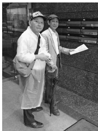
雨の中で法人事業所訪問

問が重要です。多くの仲間の行動参加で、組織現勢の回復とともに拡大目標を達成させましょう。