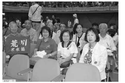
荒川原水協の参加者たち

いろいろな年代の方がこの問題について考え、自分達の出来る行動に取り組んでいるのだと思い、私も大変勉強になりました。