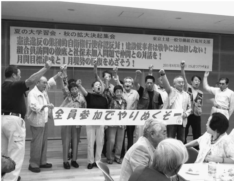
多くの仲間の行動参加で拡大目標を達成させよう

【組織部発】秋の拡大月間における支部目標は90人です。8月26日(10月1日加入)から、すでに拡大月間は始まっており、終わりは10月31日(11月1日加入)までとなります。月間に突入してからの最初の拡大の取り組みは、支部四役・常任執行委員、書記局で構成している支部拡大推進委員による日暮里地域の未加入法人事業所訪問でした。社会保険加入の有無実態確認や取引のある下請け業者の土建への紹介のお願いなども話してきました。早期に組合加入という結果に結びつく行動ではありませんが、地域の法人事業所の実態把握にもなります。