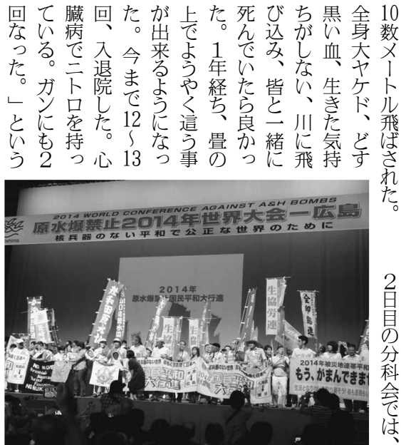
全国から平和を願う声が集まる

初日の6500人が参加した開会総会で、特に印象に残ったのは、御年89歳の日本原水爆被害者団体協議会(日本被団協)の坪井直(すなお)代表委員の挨拶の中で、「20歳の時に爆心地から1kmの屋外で被爆、10数メートル飛ばされた。全身大ヤケド、どす黒い血、生きた気持ちがない、川に飛び込み、皆と一緒に死んでいたら良かった。1年経ち、豊の上でようやくこの事が出来るようになった。今まで12〜13回、入院した。心臓病で二口を持って回った。」という