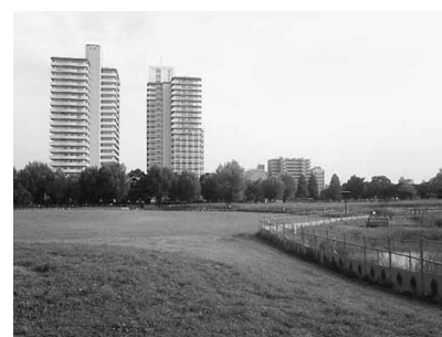
公園の全面開放が待ち遠しい

もともとこの一帯は、旭電化工業(現在は株式会社ADEKA)の工場跡地で、昭和55年に東京ドーム4個分の土地を東京都が購入しました。西半分は、現在の首都大学東京荒川キャンパスとなっており、東半分