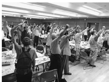
「目標達成、ガンパロー」

問が重要です。多くの仲間の行動参加で、組織現勢の回復とともに拡大目標を達成させましょう。