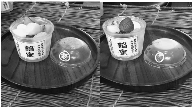
バラエティに富んだあんみつは大人気で新商品続々

サーフィンでバリ島の雰囲気が好きなことから、店内は南国のリゾートを思わせるインテリアです。 テレビ番組などに取材されると遠方からの来客が増えますが、一日の製造には限界があるため、製造が間に合わなくなり地元近隣のお客に迷惑をかけるので、あまり宣伝はしないそうです。蒟蒻などの新商品を次々開発しつつ、地域と共に歩み繁栄し、愛されるお店へと話していました。