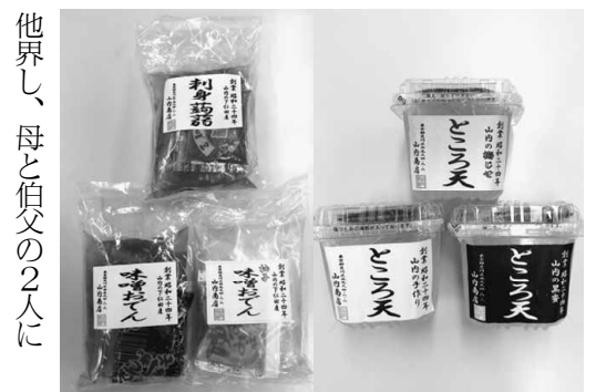
昔ながらの定番こんにやく&ところ天

サーフィンでバリ島の雰囲気が好きなことから、店内は南国のリゾートを思わせるインテリアです。 テレビ番組などに取材されると遠方からの来客が増えますが、一日の製造には限界があるため、製造が間に合わなくなり地元近隣のお客に迷惑をかけるので、あまり宣伝はしないそうです。蒟蒻などの新商品を次々開発しつつ、地域と共に歩み繁栄し、愛されるお店へと話していました。