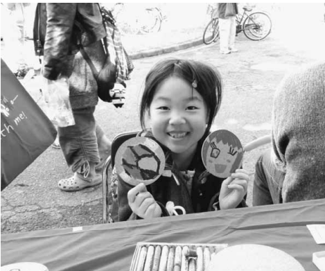
「カワイイのができました！」

算要求中央総決起大会として集会を開催し、7月と同様に隣の日比谷公会堂にも野音の集会の様子が同時中継され、荒川支部はそちらに参加しました。集会がカンパローで閉会し、その後は銀座通りを歩き東京駅先の鍛冶橋までデモ行進をしました。集会のテーマに掲げていた「賃金・単価を引き上げろ！」をはじめ、「建設国保を守れ」「建設アスベスト被害者を救済しろ！」「消費税増税反対」「公契約法を作れ」「建設アスベスト被害者を救済しろ」といったシュプレヒコールを響かせました。支部からの参加は38人でした。