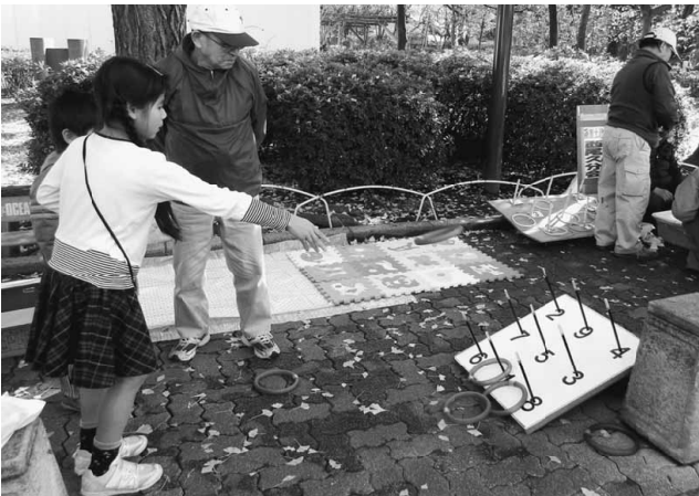
「それっ！」簡単に思えてなかなか難しいみたい

支部の企画取り組んで包丁研ぎは294丁、住宅相談が8件、工作教室は諸事情により丸太切りのみで取