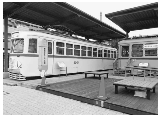
土日祝日の昼間には広場内を開放も

都電はかつて都内の交通機関の主役でしたが、自動車の普及、増加による運行の困難と交通局の経営悪化によって次々と廃止された。その中で最後まで残った2路線を一本化し、昭和49年10月1日に都電荒川線が誕生。東京都交通局では、この10月1日を「荒川線の日」としている。そして、荒川電車営業所(荒川車庫前)は現存する唯一の車庫で、敷地内「都電おもいで広場」には保存車両が展示。先の10月5日に、都電荒川線命名40周年「荒川線の日2014」記念イベントが開催された。車庫内には品販売、普段は見ることができない都電の車庫及び都電車両の床下を見学したり、都電荒川線マスコットキャラクターの「とあらん」が登場するなどにぎわいをみせていた。 毎年、6月の「路面電車の日」と10月の「荒川線の日」を記念し、営業所内を公開するイベントが行われるのが恒例。