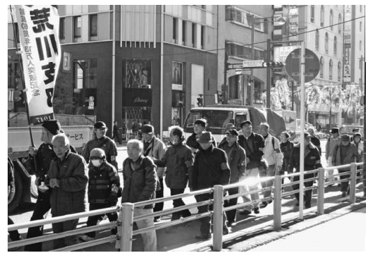
支部旗を先頭にデモ行進する仲間たち