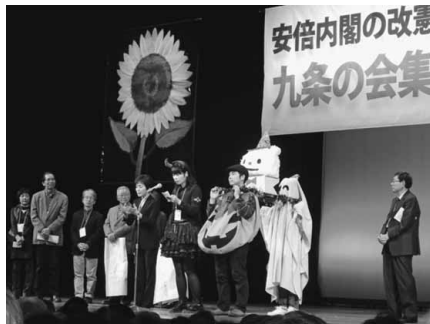
宮城青年9条の会はコスプレで参加

【旅行の際は持参を 国保宿泊補助制度】国内で宿泊旅行する際にこの宿泊施設を利用しても、土建国保に加入している組合員・家族ともに、1人年度内(4月1日~3月31日)に1回で64歳以下では3000円、65歳以上は5000円の補助をしています。 【国保係】国内で宿泊旅行する際にこの宿泊施設を利用しても、土建国保に加入している組合員・家族ともに、1人年度内(4月1日~3月31日)に1回で64歳以下では3000円、65歳以上は5000円の補助をしています。 なお、所定の申請書を旅行の際に持参すると便利です。補助金はゆうちょ銀行口座宛に振込まれます。