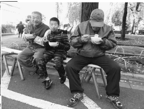
「おいしいね！」と舌鼓

声も多く寄せられていきます」という声も多々寄せられていきます。また、事前にも今年の開催日程や内容について等問合わせがあるほど、地域住民の認知度は確実に高まっています。