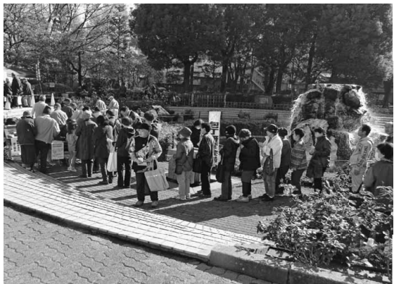
包丁研ぎは受付開始前から長蛇の列に

各分会の取り組みも多彩で、焼きそばやフランクフルト、豚汁、おでんといった食べ物から新鮮野菜やまな板の販売やバザーなど、事業所分會では、フォトフレーム作りの体験