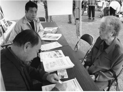
相談はまかせて安心地元の職人に

発行所 東京土建一般労働組合荒川支部 東京都荒川区荒川6-3-1 TEL(3892)9131 FAX(3892)9381 発行者・豊田佳二/編集長・川又好一 http://www.doken-arakawa.org/