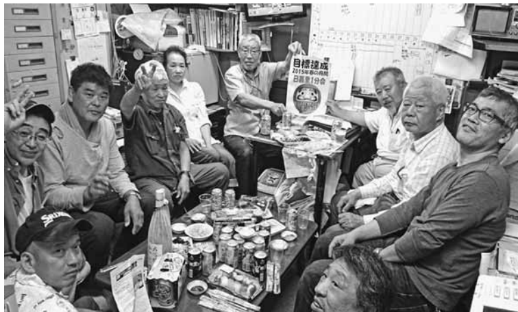
日暮里1分会行動日最後の日に目標達成しました

【組織部発】3月末に始まった拡大月間も目標69人に対し、69人の到達を築き、本部目標、支部目標と