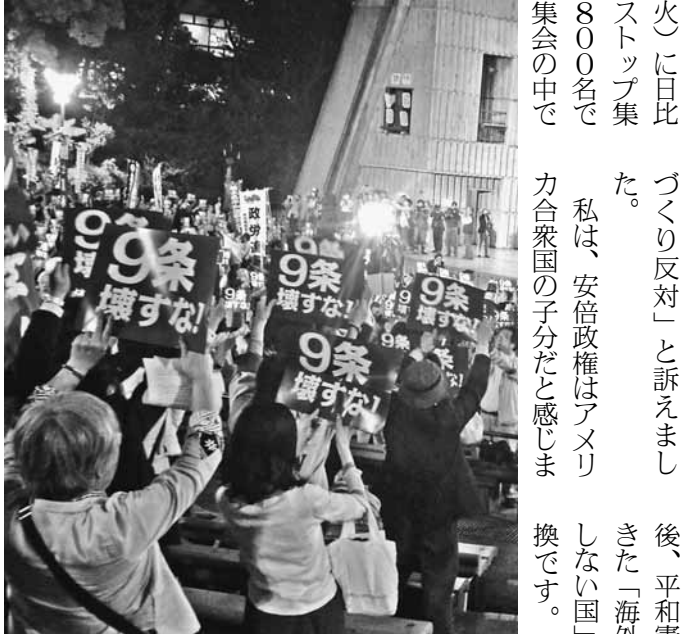
「9条壊すな」と声をあげ