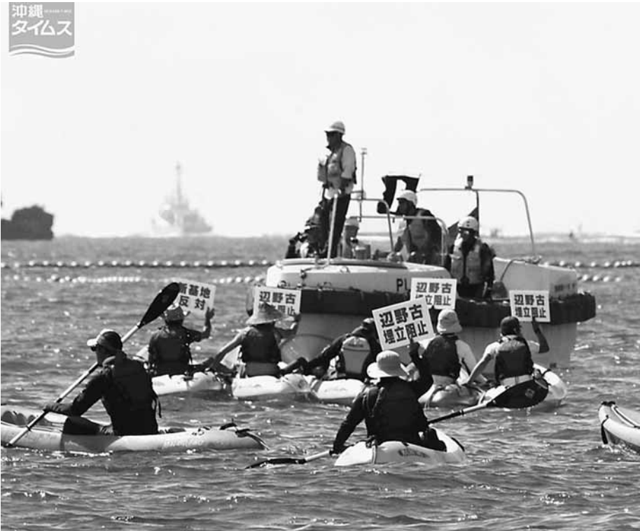
基地建設に反対する市民ら。(写真: 沖縄タイムス)