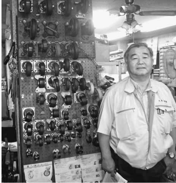
様々なキャスターと社長がお出迎え

と考へ、お兄さんとの仕事を辞めて、昭和33年頃から仕事として始めた。その当時はまだ重量物の運搬が主流だった。初めは北区昭和町から今の西尾久