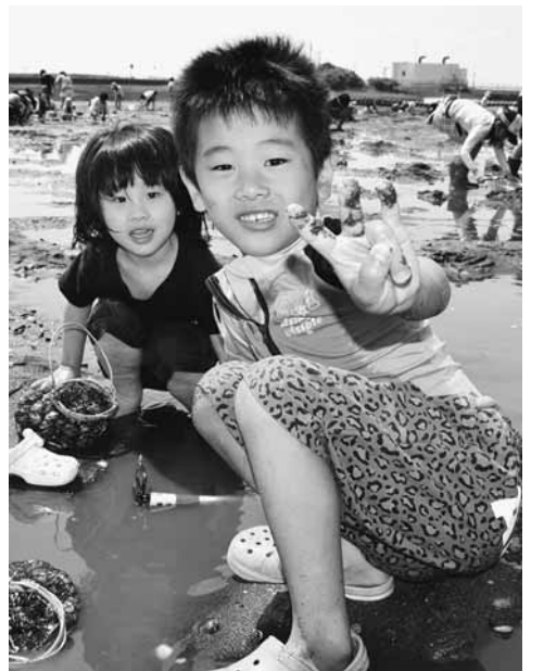
いっぱいとれたよと笑顔を見せる

海岸へ向かいました。「昨年よりたくさん取れた」との声が多くあり、網いっぱいのあさりを持って、次の目的地、三日月ホテルへ向かいました。ホテルではバイキング形式の昼食をとり、食後は