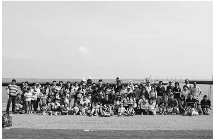
参加者全員で集合写真

【後継者対策部発】5月17日(日)に参加者87人で木更津・牛込海岸での潮干狩りと三日月ホテル竜宮城スバに行ってきました。支部を6時30分に出発し、バスの中ではスケジュールが発表され、子供たちはわくわくしているようでした。道路は渋滞もなく順調で、8時には牛込海岸に到着しました。とても天気が良く、まさに潮干狩り日和でした。集合写真をとったあと、