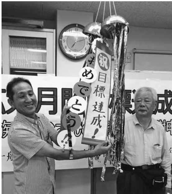
目標達成おめでとう!

【組織部発】3月末に始まった拡大月間も目標69人に対し、69人の到達を築き、本部目標、支部目標と 【組織部発】3月末に始まった拡大月間も目標69人に対し、69人の到達を築き、本部目標、支部目標と