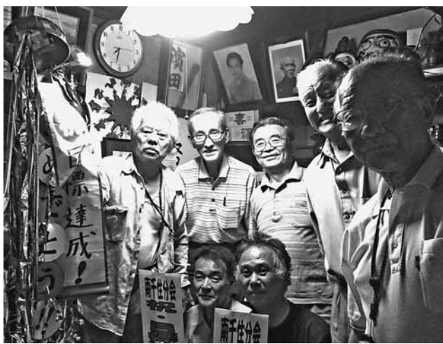
目標達成分会はみんなで打ち上げを ① 西尾久分会 ② 町屋南分会 ③ 南千住分会

【組織部発】3月末に始まった拡大月間も目標69人に対し、69人の到達を築き、本部目標、支部目標と