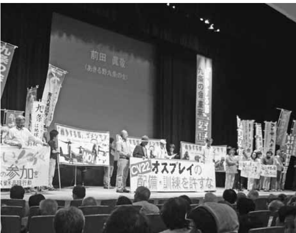
舞台上がり各団体がアピール