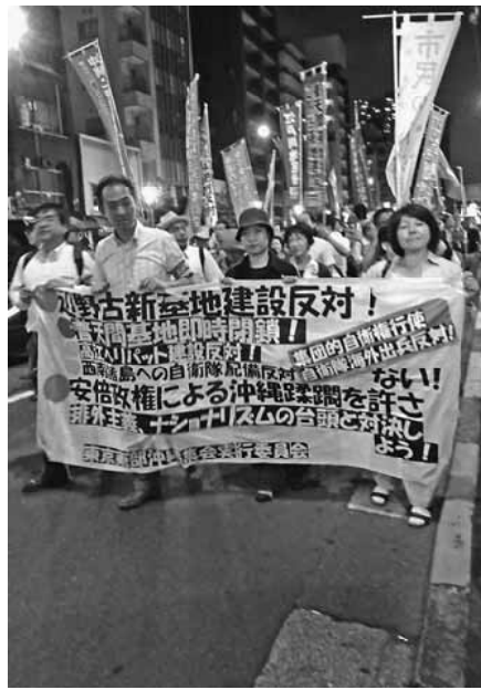
集会後にデモ行進

戦場派遣される自衛隊員はもとより私たち自身も戦争への協力義務・徴兵制が準備されています。これまでも平和憲法に守られてき