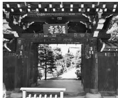
経王寺と大きく書かれた門

たため、新政府軍が発砲した9ヶ所の銃弾の痕が、現在も山門(お寺の門)に生々しく残っており、明治維新の動乱を物語っています。