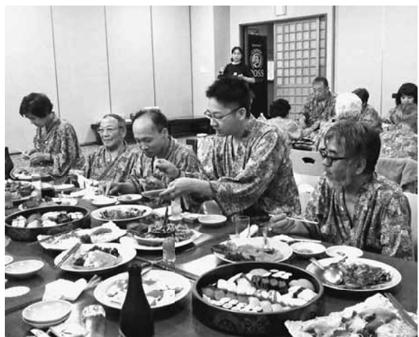
豪華な料理がたくさん並ぶ

日(日)、草加健康センターで分会レクリエーションに取り組んだ。参加者は23人でした。若手組の5歳のお嬢さんから90歳の元組合員まで、幅広い年齢層の組合員と家族が集まっ