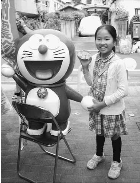
日暮里1分会はドラえもんがお出迎え

発行所 東京土建一般労働組合荒川支部 東京都荒川区荒川6-3-1 TEL(3892)9131 FAX(3892)9381 発行者・豊田佳二/編集長・堀井龍二 http://www.doken-arakawa.org/