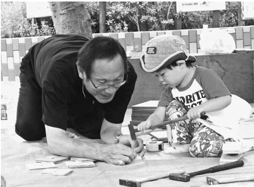
子ども工作教室でくぎ打ち体験中(荒川)

会場は、荒木田ふれあい館近くの江川堀児童遊園で行われた。小学生達から「ばかぼん公園」と呼ばれ、親しまれている公園です。