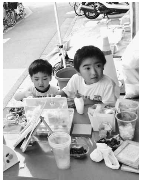
兄弟でフォトフレーム作り(事業所)

(取材・東尾久二・今野正 夫記者) テントでは木工教室、テブルdeボウリング、ミニ販売、包丁研ぎを受付していた。私が取材に行った時は、女の子が三人来ていた。岩井さんから話を聞いたら、「最近子ども達が、少なくなりました」と話してくれた。組合員6人が参加して、住宅デーを盛り上げました。木工教室と包丁研ぎは来場者から喜