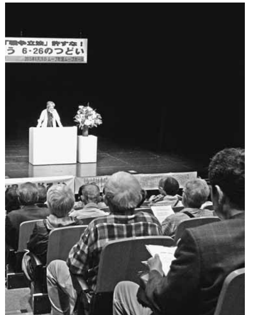
熱心に講演を聞く会場のみなさん

最後に、荒川区9条の会事務局から「いま憲法9条は存亡の岐路に立っている」という訴えと提案がありました。活動の提案としては法案が国会に提出される8月まで戦争立法阻止の行動を強化すること、あらゆる署名行動を行うこと、地域との連帯を強め共同の行動を働きかけることなどが話されました。閉会の挨拶があり、終了しました。