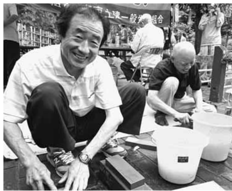
笑顔で包丁研ぎ(日暮里2)