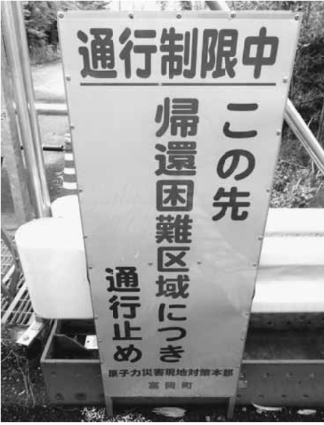
看板が置かれ通行止めに

2011年3月11日14時46分、日本の三陸沖で、マグニチュード9.0の地震が発生した。日本の観測史上最大であった。地震発生41分後の15時27分の第一波以後、数次に渡り福島第一原子力発電所を、大きな津波が襲い原発事故となる。政府は4月1日に震災の名称を「東日本大震災」とする事を閣議了承した。その後、4年4ヶ月近く経った7月