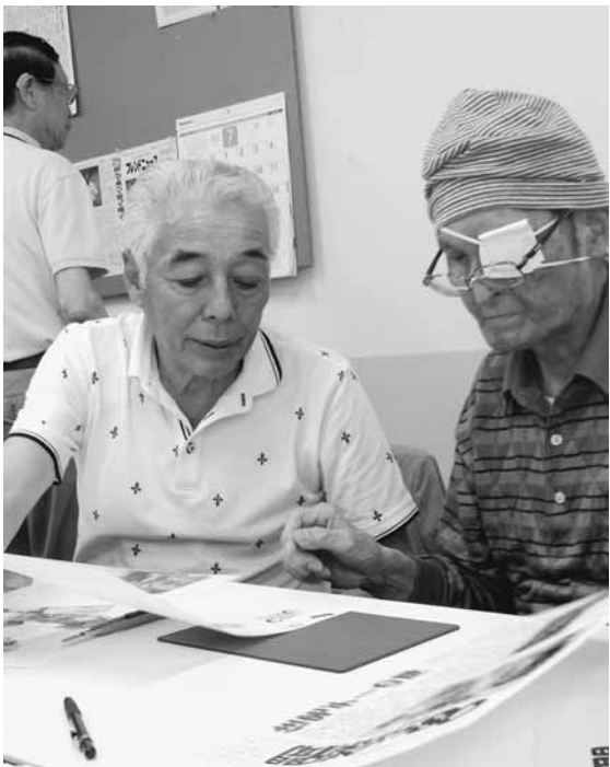
真剣な表情で新聞づくり (日暮里2)

略して土地造成をしている現実。韓国、竹島の領有権。中国漁船の珊瑚の密漁問題。地下資源問題」など国防の中枢問題の質問ばかりであった。私は知る範囲で慎重に問題の一つ一つに答え、最後に一言「人間は過去の歴史に学ぶことによってのみ、前途が開かれる。そして、もしもこの法案が成立したならば、日本は世界から孤立し各国々から不信の目で見られるであろう」と答えた。 (H)