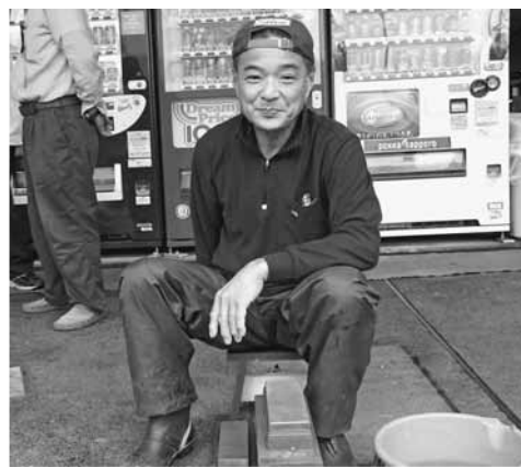
包丁研ぎが大盛況

南千住分会では汐入にある相原宅の居酒屋「とうちゃん」前で今年も汐入地域住宅デーを行いました。参加は、男性組合員が17人、女性5人の計