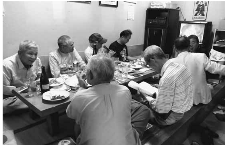
終わった後はみんなで一杯

再開発される以前の汐入地区は個人住宅が多く、下町の人情味あふれる町でした。例えば、出かける際にも隣近所に声をかける