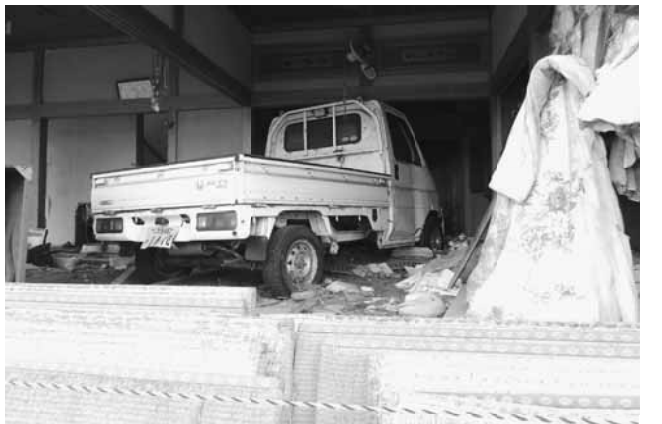
津波で流れ込んだトラックが家の中でそのままに

「全部あの日のままでよ」人が住まない家は4年も経つとほとんど壊れていき、庭はジャンケルの様だった。 居住制限区域と帰還困難区域はガードレールで区別されている。空気は一緒だが、自宅がどちらになるかで賠償金の差があり、仮設住宅では仲が悪くなる。 今の福島は前代未聞の事をやっている。時間もかかる。福島で起きたことを忘れないでほしい。 私たち福島は、今もこれから必死に生きていることを、生きていくことを。訪れて感じたことは、福島の方々とつながりを持ち続けて、新たな協力の方向を見つけ、共に協力しあえる仲になりたいと考えている。