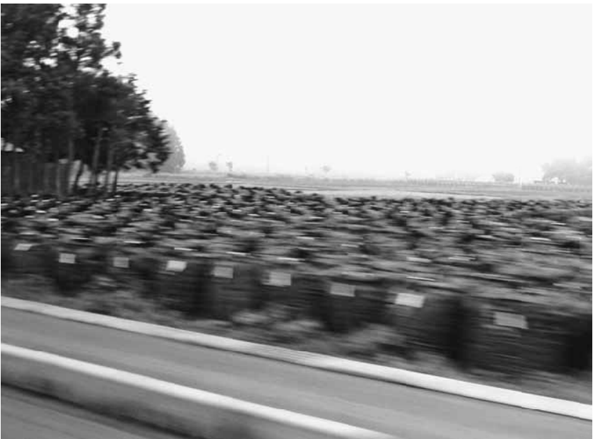
バスで走行中に撮影。道の左右にたくさんのトン袋

て来た。福島は複合の災害にあってしまった。 地震の翌日12日の朝、防犯カメラで「避難しろ！避難しろ！」というだけで、何処に避難したら良いかは知らせてはくれなかった。川内方面ではないかと言