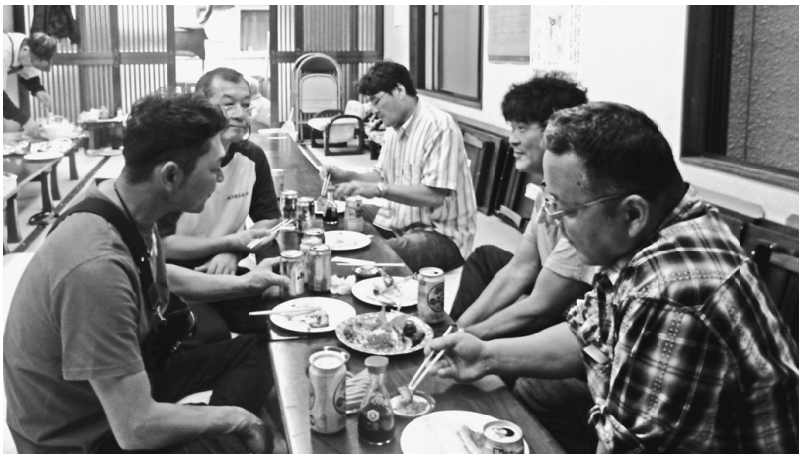
サンマを食べながら交流 (日暮里1分会)

荒川分会の目標数は10人で、現在の新加入者数は2人です(10月6日現在)。後半戦もたくさん仲間の仲間を集めて訪問し、最後まで頑張ります。