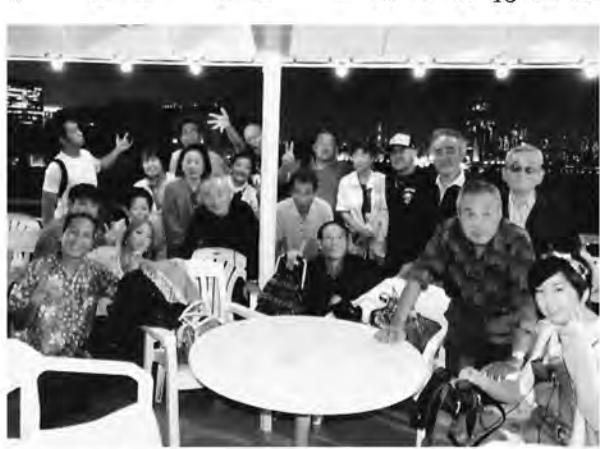
たくさんの仲間が参加しました

当日の参加者は全体で22人でした。参加者には青年部に入っている若い組合員も彼女を連れて参加してくれまし