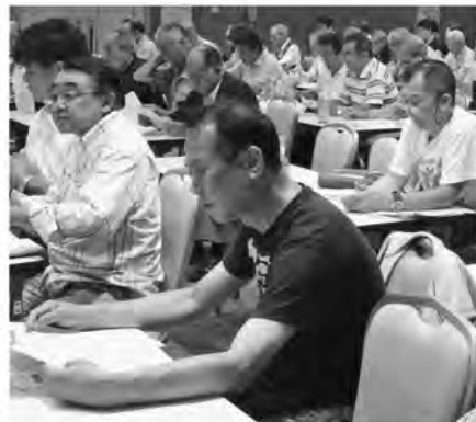
真剣な表情で学習

安倍首相は「普天間飛行場の危険性除去のために辺野古移設は避けることはできない。全力で取り組んでいきたい」と辺野古新基地建設を推進する意向を改めて表明しました。さてアメリカは何を考えているか。外見では沖縄問題は日本国内問題としているが、実は水面下では財界と結託してアメリカ自国の利益のために、安倍指人形の中でアメリカ指と財界指が激しく動いています。