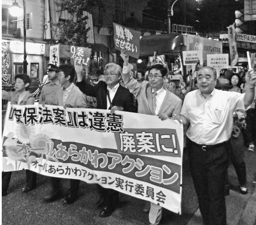
9条を守れ！戦争させない！と声を上げデモ行進

【憲法学者の99%が違憲】と判断する安保法案を衆議院で可決を強行し、参議院でも押し通そうとしているなか、あらゆる階層の方々が自主的に「法案通過は許さない」の声をあげています。医師や弁護士や教職員、労働者など1000人を超える呼びかけ人で取り組みが行われました。