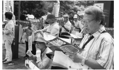
一斉に声をあげて訴える

加者は2ルート(渋谷方面と原宿方面)に分かれてシユプレヒコールをあげながらデモ行進をしました。定権が蹂躪されている」と訴えました。沖繩にこれ以上大きな基地はいりません。私たちは国会を取り囲み「軍事基地はいらない」「平和に暮らしたい」「2