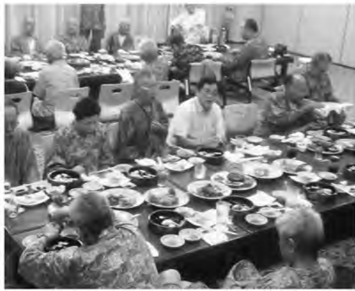
草加健康センターで宴会

午前9時に支部会館3階に集合し、ミニ学習を行いました。ミニ学習の内容は腰痛になっ