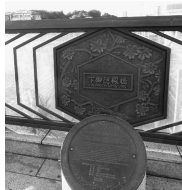
列車の見えるバルコニー

成7年3月までかかった。橋の幅員は15メートルとなり、長さは100メートルだ。新幹線をはじめ数多くの種類の列車が、1日約2500本通過する日本有数の跨線橋となった。新しい下御陰殿橋は、和風のデザインでバルコニー付きの広い歩道があり、列車ウォッチングができる生きたトレイン・ミュージアムとして蘇った。御陰殿は寛永寺の第七世公遵法親王が、宝暦4（1754）年に隠居され、約三千坪の敷地に建てられた隠居所をいう。この御陰殿は彰義隊の戦いで焼失して、明治政府が「駒形どじょう」に払い下げたが、日本鉄道会社が上野、熊谷間に鉄道を敷設するの失われた。その正面の音無川に架けられていた石の大橋を御陰殿橋と言った。