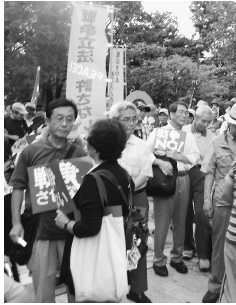
区役所前公園にはたくさんの参加者

【西尾久・小野澤富彦記】で、「安保法案廃案！オール荒川アクション」が11日（金）午後5時から荒川区役所公園「トII」が行われました。