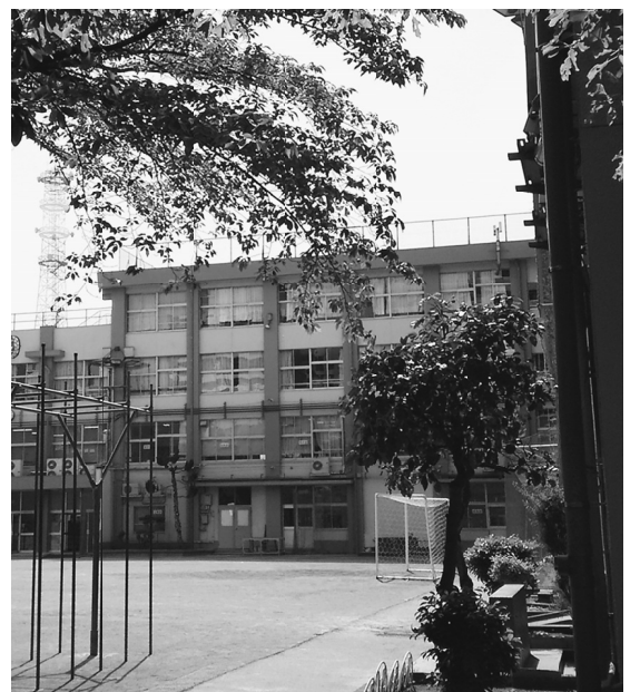
創立129年を迎える現在の校舍

きる子」の育成に力を入れています。今年度も「夢や希望の実現に向かってたくましく生きる子」の育成に力を入れています。また、パソコン、電子黒板の活用や、専門家による俳句教室、書道家を招いての書道教室など最新機器を用い学習する反面、伝統文化の学習も行っています。