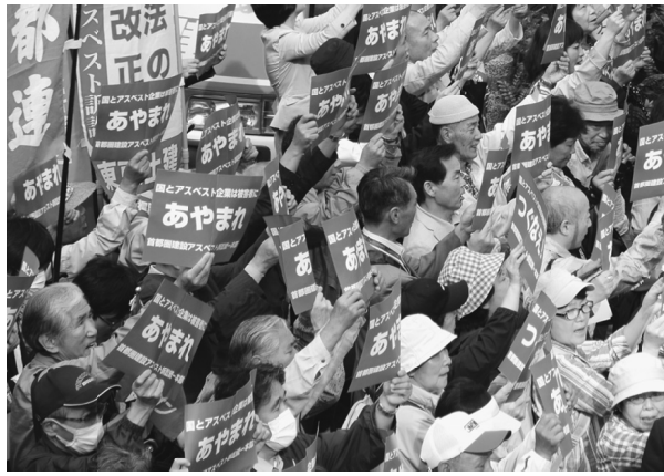
太平洋セメント前で訴える

【荒川・磯部正三通信員】5月20日（金）「建設アスベスト（石綿）被害の早期解決・全面補償を求め全国総決起集会」が、首都圏建設アスベスト訴訟統