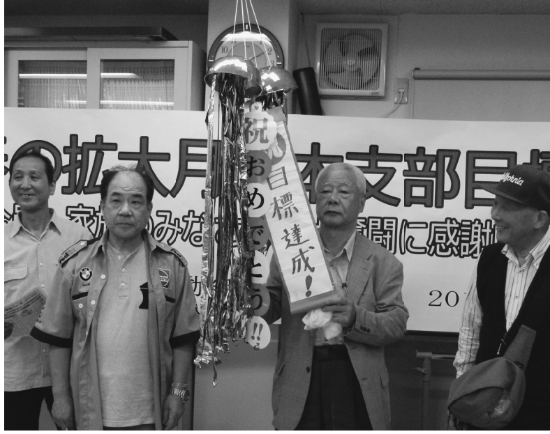
目標達成おめでとう!