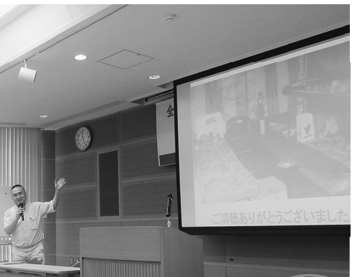
人骨の会 鳥居事務局長による説明

当時の関係者への聞き取り調査では、旧陸軍防疫部研究室軍属に所属していた方から「水瓶の中にホルマリン漬けにされたアジア系の人種らしき生首をみたことがある」、