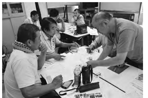
新聞づくり学習会の様子

全分会へ の呼び掛けを 行いました が、参加は 7分会と主 婦の会、荒 友会となり ました。 三木常任 中執から、 分会新聞を 発行する意 義が述べら れ、「分会 の活動をい かに知って もらうかが