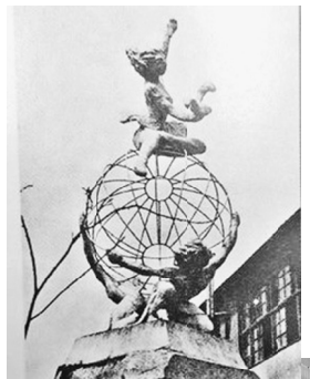
昭和30年7月20日に当時の美術部員の総力をあけ、「教育の現場に生かしたい」との思いで一か月の時