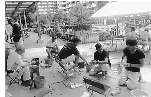
包丁研ぎで大忙し