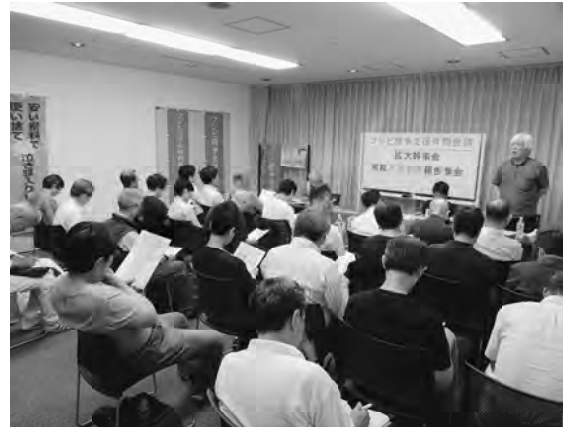
多くの幹事が集まり仲間を勇気づける

本件の「スラップ訴訟」 は、富士美術印刷(フジ ビ)が争議行為を理由に法 外な損害賠償2200万を 求め、被告から労働組合を 外して争議団の中心メンバ ーである組合員3名を狙い