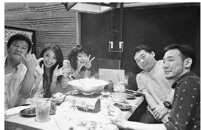
参加者が少なかったことで濃密な時間に…

【国保係】国内で宿泊旅行するどこの宿泊施設を利用して、土建国保に加入している組合員・家族とも 旅行の際にはぜひ利用を 宿泊旅行利用補助金制度 座宛に振込みされま 1日(3月31日)に1回で64歳以下では3000円、65歳以上は5000円の補助をしています。 新年度保険証とともに受け取る「土建国保カード」の巻末にある申請書を切り離して使用して下さい。手元になります。 75歳以上の組合員の場合は、どけん共済会の同様の制度を利用となります。