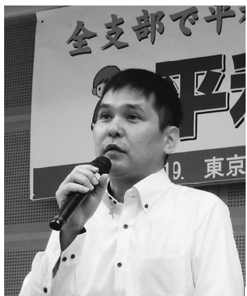
沖繩タイムズ 宮城報道部長

より起訴が確定するまで犯人の身柄は日本に引き渡されることはなく、ろくに捜査が行われない事件や事故も多いとのこと。