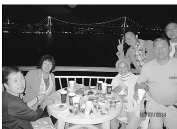
荒川分会納涼船レクにて