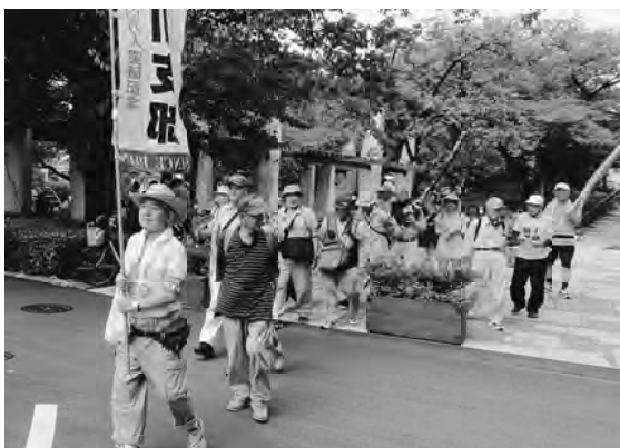
花川戸公園を目指して元気に出発

手助けをしたことになり 憲法違反は明らかです。 核兵器は一瞬で多くの人 命を吹き飛ばすだけでな