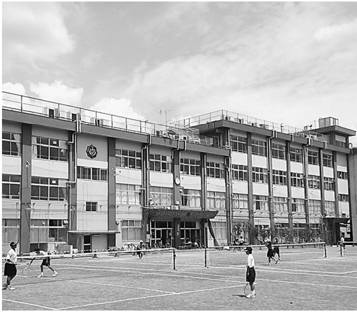
暑さに負けず部活動に励む生徒達