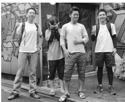
重力にあらがってきました

内には疲れてきたり。また「お前に登れるなら」と段々とムキになるけど登れなかったり。箸が持てなくならない程度に遊び、焼肉懇親会へと向かいました。