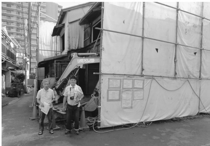
秋の長雨もこの日は我慢してくれました

業所や組合内事業所からの問い合わせが多く寄せられ、加入に結びついていきます。目標70人まで、残すところ24人です。引き続きご協力をお願いします。ことが出来ません。分会として、過渡期のような難しい時期にきている節もありま