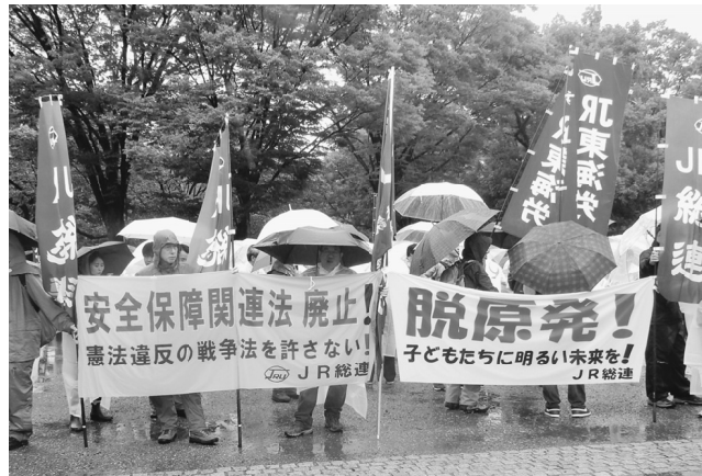
日本には戦争も原発も要らない

1兆2千億円の税金を使って建設され22年間で2500日しか稼働していない「高速増殖炉もんじゅ廃炉か？」のニュースが報道された9