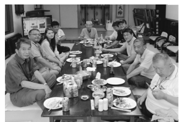
着は3(人の新たな仲間)?

個人の方を訪ねました。久しぶりの晴れ間ということもあり、留守のお宅が多かったです。拡大行動も終わり、いよいよ、さんまパーティーです。参加者は40人を超え、家族で参加してくれました方もいました。拡大行動から戻った仲間と、「今日の行動どうだった?」など話しながら、さんままで一杯やりました。さんま効果で見込みのある対象者を3人掘り起こすことに成功した貴重な行動になりました。