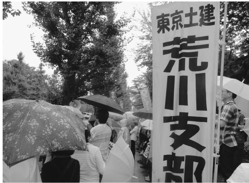
雨でも人で埋め尽くされる沿道

改憲運動を背後で推進しているのは「日本会議」であり、国会議員717人中約280人が「日本会議国会議員懇談会」に加入している現実がある。(H)