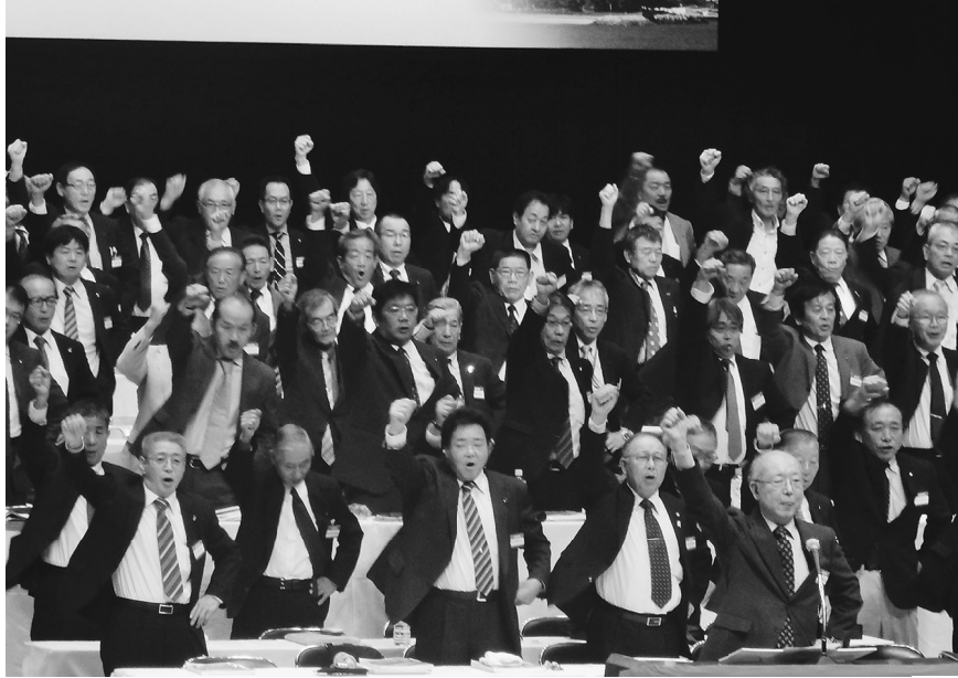
全国60万超の仲間の仕事と暮らしのために