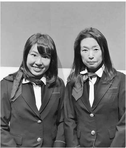
CAに変わった服装の姉妹？

うので、こんなに色々な結び方があることを知った。みなと博物館では、この辺は埋め立てで作った場所なので、大きな地図の上に乗って見てビックリ、驚きの連続だった。