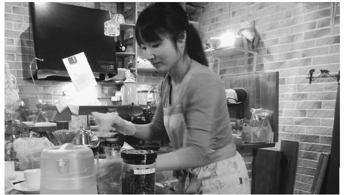
一杯ずつ心を込めて店主がおもてなし