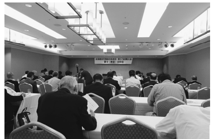
教宣分科会の様子

1日目は13時から17時の予定で始まり、東京土建は全建総連（61万4068人）6月末現勢）最大の組合として152名で参加、全国各県連の参加組合員は1489人で開催された。「この1年を振り返って」昨年の大会以降、1年間にわたり全国で開催された全建総連の運動の成果と教訓を確認した。来年3月に期限となる社会保険未加入対策をさらに進め、建設業における担い手確保育成に向け、賃金単価の大幅な引き上げの実現など、1年間の運動方針を確立するための第57年度運動方針（案）が発表された。