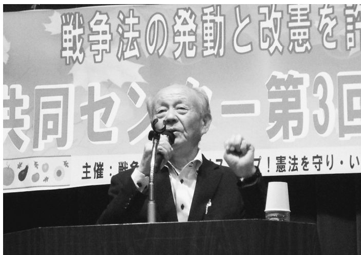
各団体代表挨拶の一幕

の米山淳子副会長が主催者あいさつを行い、次に日本共産党の山添拓参議院議員が国会情勢を含むあいさつに駆けつけ「今以上に野党と共闘の体制が確立さ