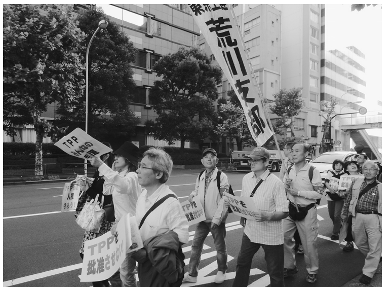
国内産業の崩壊を招くTPPへの参加は断固反対

【町屋南・薄井章通信員】安倍内閣は、私たちの命や、食、暮らし、地域を脅かすだけでなく、参加各国の労働条件が悪化し労働権を奪い、人権も踏みにじる恐れのある、TPP（環太平洋経済連携協定）と関連法案をこの臨時国会で批准、成立させようとしている。