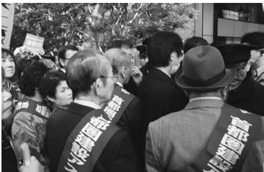
入口では原告団と警備員が押し問答に

【記事・写真 記者竹達浩(南千住)】11月4日、お台場海浜公園駅前にある「アスベスト裁判被告企業「太平洋セメント」に、速やかに被害者との話し合いに応じるようにと、首都圏建設アスベスト訴訟原告団と首都圏建設労働組合から、約2千人が集まり太平洋セメント本社の包囲行動を実施しました。