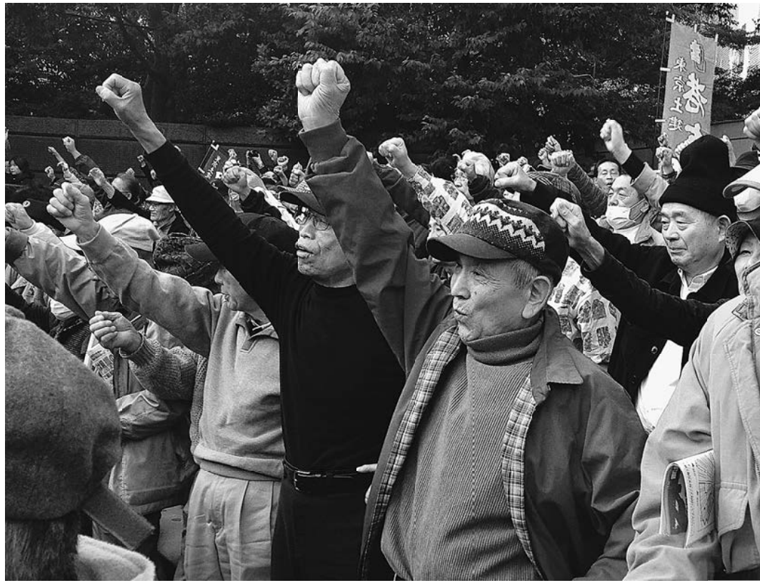
安心して暮らせる社会をめざして団結ガンバロー

この近代化だけは順次進められているとの回答ですが、その他の項目については検討しますとの回答。いずれも実現すれば、地域の仕事確保につながる要請であり、地域の活性化につながる重要なもの