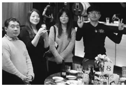
この中からカップル誕生か?

11月27日(日)上野のパセラリゾートにて開催いたしました。今回は足立、荒川、葛飾、文京、台東、5支部合同で、男性37人、女性34人で開催されました。 会場は大変広く素敵な雰囲気。8グループに別れ10〜20分程度のトークを行い、男性陣がテーブルを移動してお互いに自己紹介、次にフリートークになると初めは緊張感に包まれていた会場も、次第に賑やかな雰囲気になりました。 このパーティーのメインイベントは、気になる異性をカードに記入し、両想いの場合はカップル誕生となります。今回は5組のカップルが結ばれました。しかし、パーティーでカップルになれなくても、引き続き二次会に行く参加者もいました。もしかしたら、そこでカップルが誕生しているかも。 女性陣も出会いの場が少ないとされる看護師や介護士の方の参加も多く、組合が主催というだけでも民間のパーティーよりも気軽に参加できる大変貴重な場です。スタッフを務める書記局の皆さんにはご苦勞を掛けますが、今後も組合員の要求として継続していきたいと思っています。 いつも緊張してばかりの私ですが、会場の雰囲気や、スタッフの助けもあり自分から女性に話し掛けたり、数人に名刺を渡すことが出来ました。「いつか素敵な人とカップルになれるといいなあ」と思います。興味のある方は次回の恋活パーティーには是非ご参加下さい。