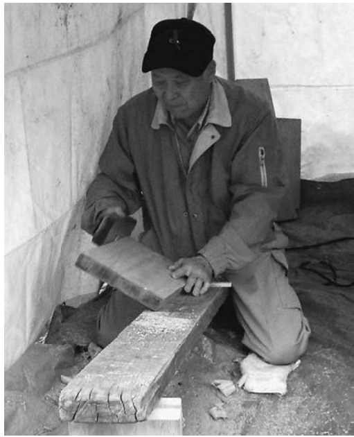
ベテランの技が光ります!