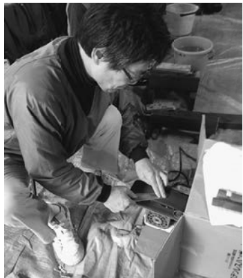
一本一本心を込めて

町屋南分会では焼きそばをメインにバザー、古本販売、本棚・プランター販売、砂利販売などを行いました