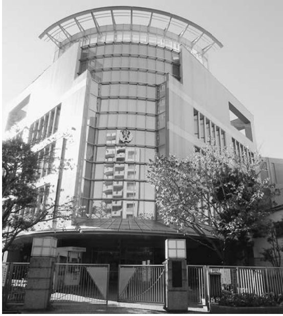
平成26年落成の新校舎

米国の田舎町に住む高校生ジェシー（エル・フィンク）はファッションモデルになるためロサンゼルスにやってきます。