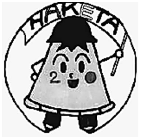
20周年キャラクター 峡田びっつん

と変更される。 1943年（昭和18年） 東京市から東京都第一峡田国民学校と変更される。 1944年（昭和19年） 学童集団疎開開始。 1947年（昭和22年） 東京都荒川区立第一峡田小学校と校名変更。 1993年（平成5年） 第一峡田小学校と第八峡田小学校の「統合新校・峡田小学校」が第八峡田小学校舎をしようして誕生。 1996年（平成26年） 峡田小学校の新校舎が現在地に落成し移転しました。