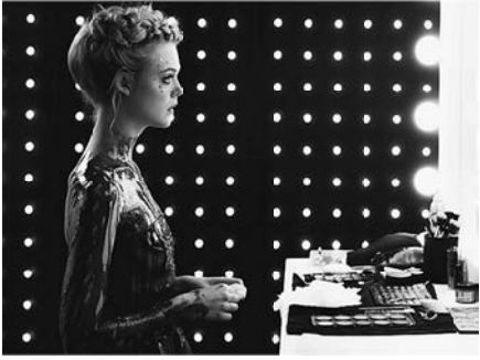
© 2016, Space Rocket, Gaumont, Wild Bunch.