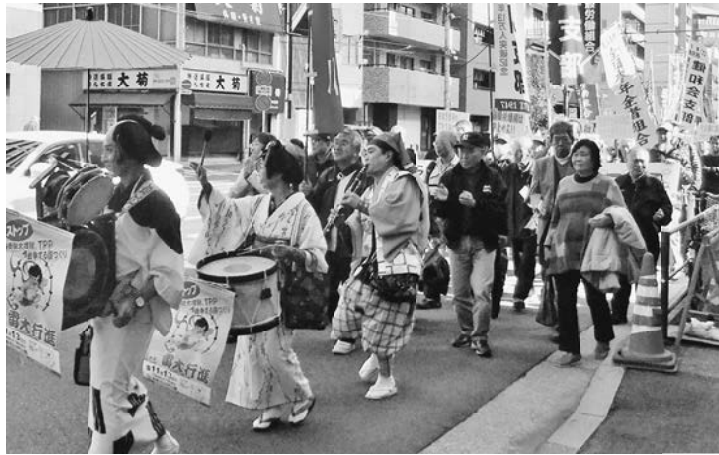
雷大行進名物ちんどんデモ

【日暮里一・堀茂男通信員】11月13日(日)浅草寺近くの花川戸公園で晴天の中、毎年恒例の「世直し雷大行進」が開催されました。 東京都7区(荒川区、足立区、葛飾区、台東区、墨田区、江戸川区、江東区)の労組、業者、市民団体が集まって、下町の仲間が共同で世の中を良くしていくことと800人が結集しました。 3つの最低保障(全国一