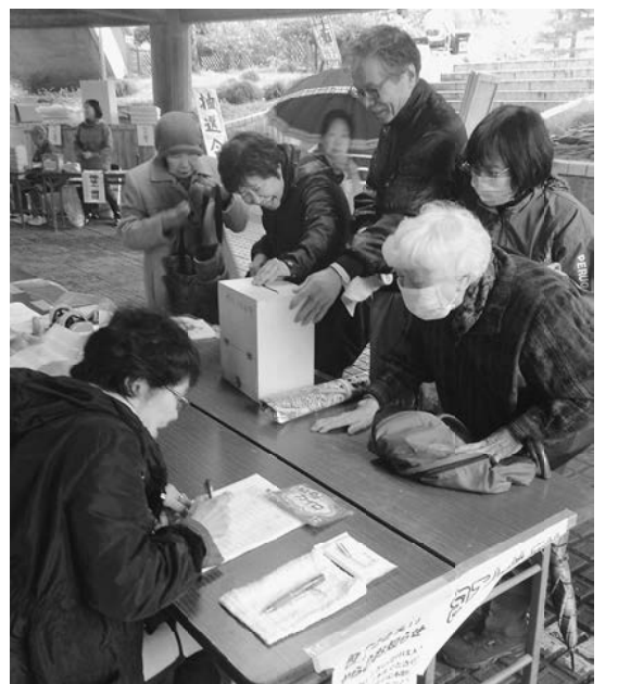
雨でも大人気の包丁研ぎ