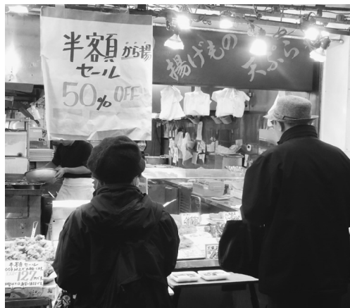
お目当てはから揚げ半額セール

「とりふじ」があるジョイフル三ノ輪商店街の始まりは大正8年、そして大正13年に商店街組合が誕生した歴史を持ちます。かつては「南千住銀座」と呼ばれていた有名な商店街だったそうです。現在のアーケード付になったのは、昭和48年、新たなジョイフル三ノ輪商店街になりました。アーケード付きの商店街は、天候に関係なく買い物ができるので大変な人気で、地域住民の生活を支えてきました。その中でも一際目を引く店構えです。