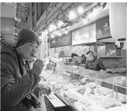
幼少期からの思い出の味

創業当時の味を受け継ぐもの、現在はお客様の生活状況が変わり、自宅で料理をすることが少なくな