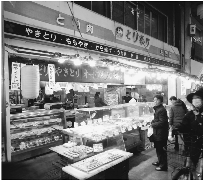
夕方になるとお客さんが絶えません

街の名店シリーズ② 「やきとり・とりふじ」 荒川区南千住1-30-8 営業時間9:30~19:00 月曜定休 ※月曜が祝日の場合は火曜休み