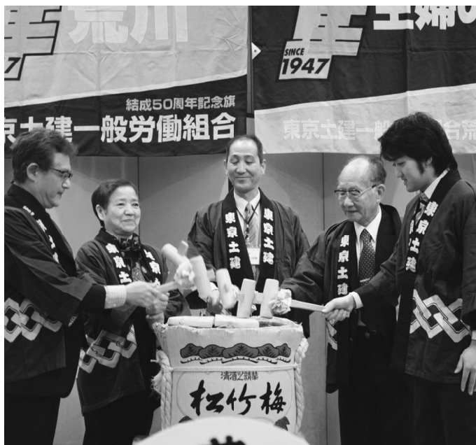
支部・シニア・主婦・青年の心を一つに

リギリセーフという事態からのスタートでした。会場が広くテーブルを置いて、も、悠々と人が行き交うことが出来て挨拶回りも行いやすかったと感じました。プログラムは、例年通りでしたが、今年は全ての会派の議員の皆さんが新年のご多用の折にご出席下さり、都議選を意識していたのか、全員が熱の入った挨拶