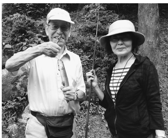
2011年分会レクでの一枚

き鳥は16種類も用意され、食べて帰るお客様にはなるべく焼きたてか、暖めてから提供してくれるので、その場で美味しく頂けます。取材に伺った時も、焼き鳥のたれが焦げた香ばしい香りが食欲をそそります。取材に行ったものの、我慢で