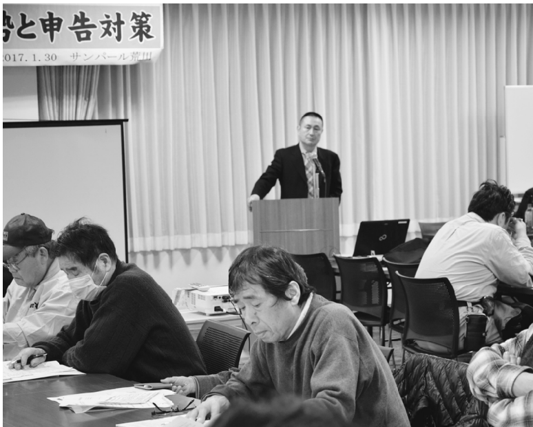
知らない損をするので参加者も真剣です

税金対策の手引き2017を使用して政治・経済、税財政、社会保障をめぐる情勢などの説明がありました。大企業が内部留保を増やしていることや、多国籍企業のタックスヘイブン(租税回避地)利用による課税逃れの問題などが紹介されました。また、現行の請求書等保存方式に代わり、2021年4月に導入予定となっている消費税の「適格請求書等保存方式」が実施されようとしています。この方式では、消費税の免税業者が発行した領収書では、課税取引と認められず取引先が課税されることになり、取引先から嫌がられ、その分の値引きだけでなく取引を断られることにもつながる危険があります。それを回避するには、