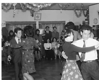
ダンスパーティーで（左側）