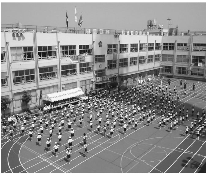
校舎と整備された校庭の様子

昭和9年に東京市尾久宮前尋常小学校として設立しました。昭和20年に戦火により校舎が焼失してしまいました。