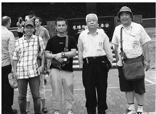
2011年原水禁長崎大会にて

昭和46年12月にお 父様が逝去し昭和47 年1月にお父様の後 を継ぎ代表になられ ました。