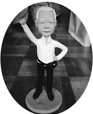
記念品の佳二人形 (非売品)

これからの豊田ご夫妻の ご健勝を2000人の組合 員を代表してお祈り申し上 げます。20年間本当にあり がとう御座いました。