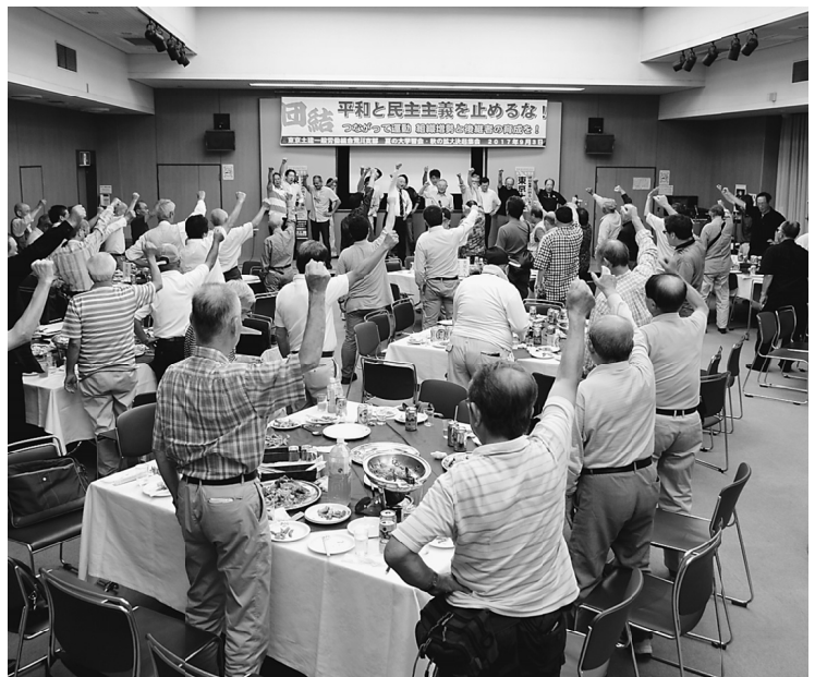
全員で最後までやりきる団結ガンパロー

今回の学習会では「加憲」の目的が、アメリカと一緒に戦争へ参加できるよりにすることだと学びました。これを阻止すべく「攻められない国創り」の世論を広げて行きましょう。