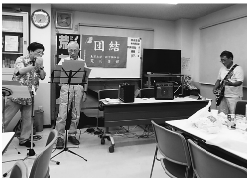
生バンドで気持ちよく歌います

21人の参加者の 中、10人位は終わ りまで唄い続けたが、 いつものカラオケと は勝手が違う生伴奏 に戸惑ってか、途中 からは聴き手に回る 人もいました。「自 分の唄う曲を前もっ て言って下さい」と 頼んでいたが、守れ ない人や、料理や酒