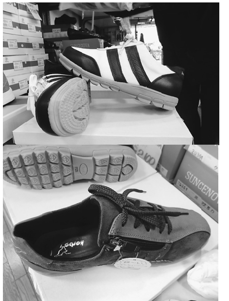
大人気のオリジナルシューズ

標だった会社を興して仕事を始める時期が来たと判断して、平成元年5月に西日暮里に新会社を設立して独立