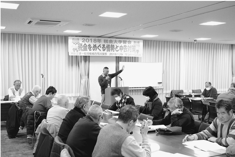
税制の見直し＝増税と心得よ

国と企業の責任追及のために、四土建(東京・神奈川・千葉・埼玉)で151人が集まり原告団を結成し訴訟を起こしたことがある。 2009年の日本の政局は、結成以来45年間も政権を牛耳ってきた自民党が衆議院を解散し、総選挙の結果、民主党が308議席を獲得し、社会民主党、国民新党との連立政権が誕生した年となった。 戦後政治の歴史的転換を果たした、民主連立政権の鳩山内閣の支持率は70%近かったが、鳩山総理の脱税問題や小沢一郎幹事長の政治資金団体の不正蓄財疑惑、普天間基地の辺野古移設問題で内閣の迷走が始まった。 国民が期待した政権交代であったが、それは政治家のお遊びだった。前自公政権が推進してきた大企業減税、庶民増税、年金・医療の社会保障改悪に憲法改悪などに対する改善施策はできなかった。 不況は深まり、貧富の格差が拡大の一途をたどり、国民の生活は困窮していった。とりわけ、私たち非組織労働者は大きな不安にさいなまれた。この苦境に對峙するのは大衆運動の前進である。 東京土建の前進は、組織自身の拡大である。組合員全員が一丸となって拡大に臨み、たまたかい3万3千人という峰を築いた。荒川支部では2400人を超え過去最高の組織人員となった。 後編へつづく