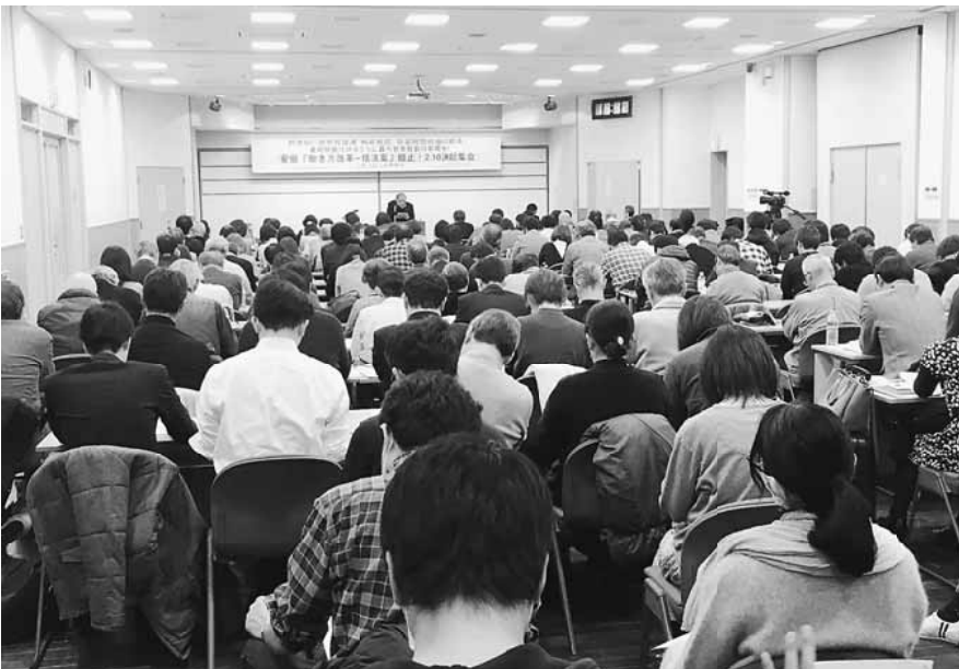
人生を左右しかねない労働法の改悪危機で会場は満席状態