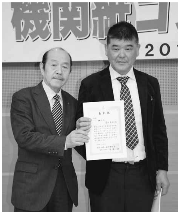
本部原澤部長と記念撮影

部員から色々な企画案が出た中で、2017年に生まれた組合員のお子さん、又は、お孫さん、その無限の可能性を持つ子ども達の写真を載せ、親御さんか、おじいちゃん、おばあちゃん、の平和についてのコメントを頂く取材記事と決まりました。