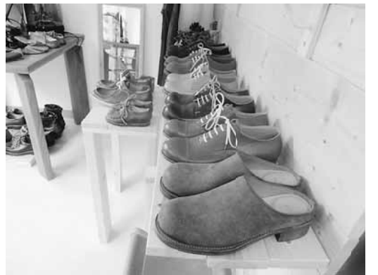
店名にふさわしい爽やかな店内

現在の台東区今戸で皮取締の特権を持った弾左衛門(後の弾直樹)は、明治を迎えた後は、軍靴の需要が伸びると見込んで、靴製造の修伝所を作りました。靴作りの歴史が浅草から始まった事が言われています。明治4年、弾さんは精力的に、皮・靴加工技術者の養