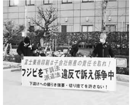
昼夜を問わずたたかった5年間

続座り込みを延べ300名の仲間と貫徹した。これら年間80回余の社前行動がフジビを和解の席に着かせ解決に追い込んだと言える。労働組合の争議の戦いは現場の大衆闘争にあった。8回に及ぶ司法と都労委による不当な決定・判決、命令に怯まず闘った当該と支援共に結果的にフジビ闘争を支えた労働者の勝利である。