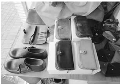
靴も小物も全て手作り

お店の名前shiroの由来は、「革製品は使用していく過程で、経年変化する事を色がつくと捉えている