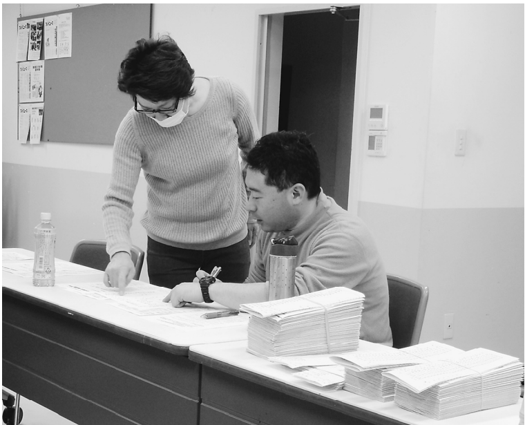
事業所分会は保険証のチェックも一苦労です

落語はボケ防止にも効果があるそうで、本日参加した36人の方にはまた来年も忘れずに参加して欲しいです。