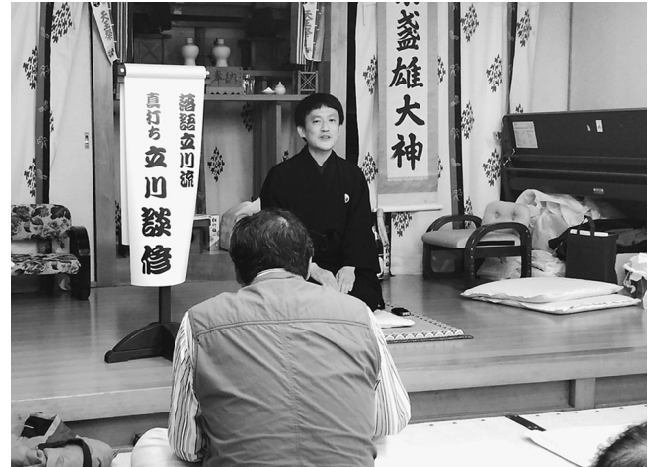
日暮里1分会では真打ち立川談修師匠の落語が

この「おれたち」に取り上げて欲しいことなどがあれば支部事務所までお気軽にお電話下さい。