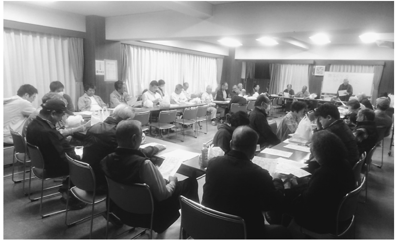
参加者でにぎわう西尾久分会総会