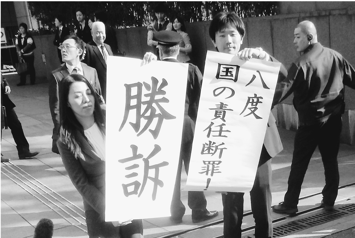
大歓声が交際を包み込んだ瞬間

3月14日午後3時過ぎ、東京高裁前 は建設アスベスト訴訟の原告団とその 支援者の歓声に沸きあがりました。 建設作業現場でアスベスト(石綿) を吸い込み、肺がんなどを患ったとし て、元建設作業員と遺族の計354人 が国と建材メーカー42社を相手に、総 額約120億円の賠償を求めた東京地 裁の判決(平成24年12月)の控訴審判