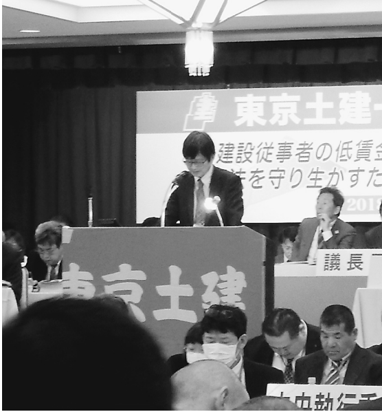
白滝本部書記長の基調報告