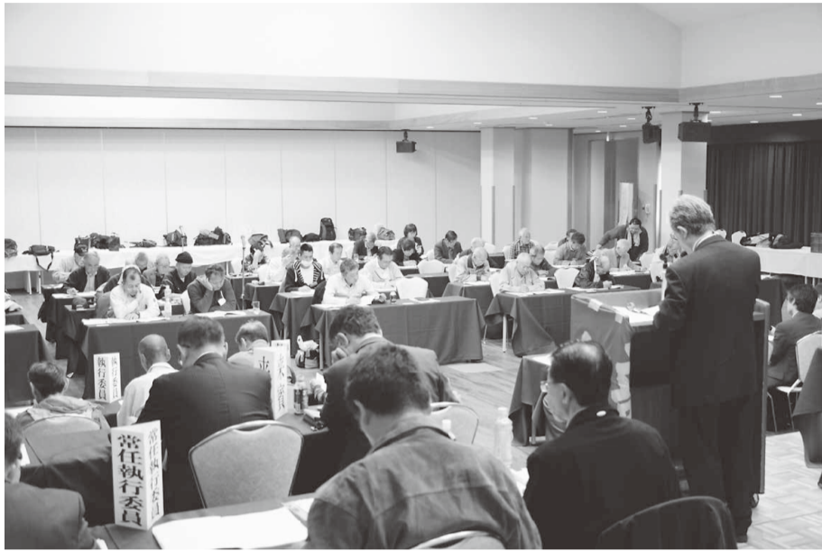
船橋書記長の基調報告