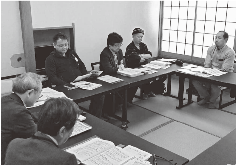
賃金・労働対策分科会の様子

ベスト訴訟の情勢や救済基金制度創設の意義、労災申請の難しさが説明されました。また、参加者から作業現場でアスベストにばく露した実体験も語られました。