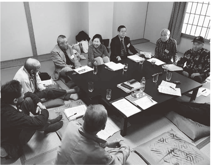
分散会では後継者問題などを討議

意点が報告されました。ハガキ要請行動については、補助金が無くなれば、国保料が倍になる為、東京土建国保に入っていない方たちも含めて、組合員全員の協力が必要である旨が報告さ