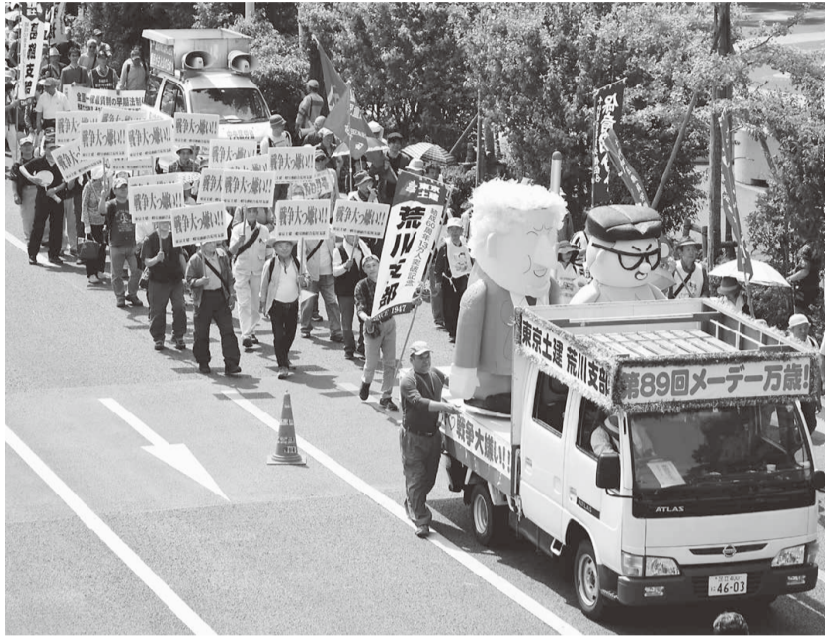
プラカードで間違い探しを企画 1枚だけハートが猫になっていました