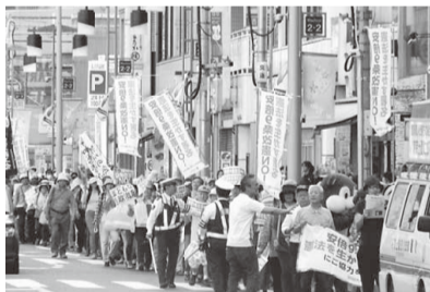
4. 22荒川市民アクションパレード