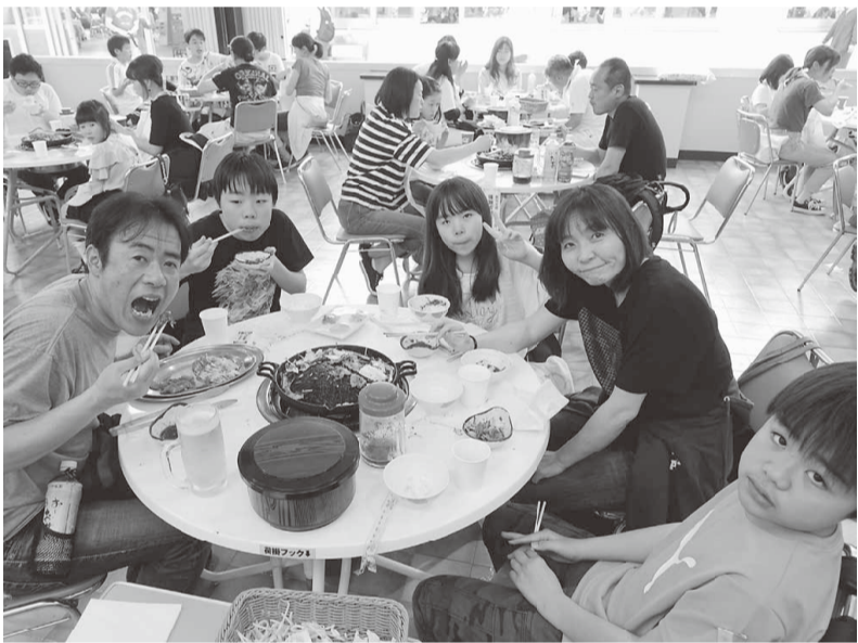
ランチは焼肉食べ放題 大人も子供も大喜び！