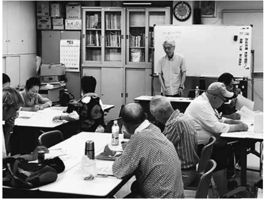
新聞づくり学習会の様子

講義で学習テキストに沿って進み、「何がわかり、何がわからないかを探して下さい」と始めました。実際に記事を書く時のポイント、読者が「知らない」事を前提に書いているかどうかです。筆者は「知