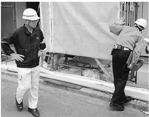
安全パトロールの様子

暑さを避ける、涼しい服装、こまめな水分補給、急に暑くなる日に注意、暑さに備えた体力づくり、体調にあわせた行動などを心掛けます。