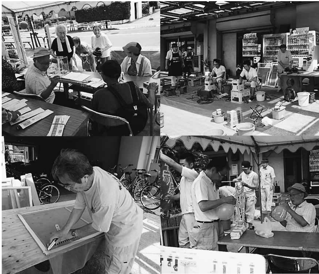
汐入住宅デーの取り組みの様子

今年も地域の医療機関「汐入診療所」の協力を得て、来場者で希望する方の健康診断も同時に行いました。診療所からは2人の看護師を含め3人の参加で、来場者の健康相談のついで、談笑をもって会場を賑わしてくれました。