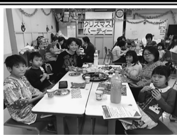
今年も大成功でした

今後地域に根付いた組合活動を展開し、地域との絆を深めて職域を守っていきましよう。