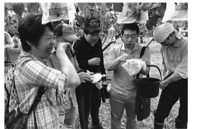
大橋副部長（右から2人目）

しかし、東京土建の活動に積極的に参加するようになってから、皆様の温かさに触れて、人付き合いも悪くないなと思うようになり、段々と自分の性格が前