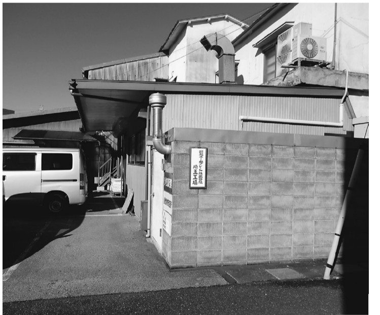
埼玉県越谷市の工場

年培われた職人技が必要です。その日の温度、湿度、インクの状態や素材に合わせた作業が必要となります。現在は中国を初めとするアジア全体に仕事は流れていますが、簡単な仕事はできても繊細な作業は日本に戻って来ているそうです。また、物作りは価格だけではなくと大熊社長は語り