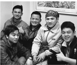
笑顔がとても素敵です

社長は「彼らは日本に働きに来る際に、送り出し機関といわれる所へ多額の金額を払います。その金額は仲介する機関によって様々で100万円から高いところまで150万円する事も有るそうです。また事前に3カ月程、日本で働くための