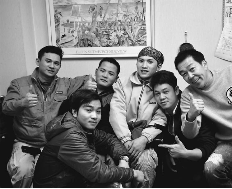
小谷社長(写真右)とベトナムからきている実習生の皆さん