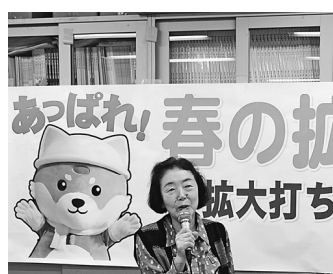
諦めず取り組み達成

日暮里二分会では、序盤から成果が伸び悩み苦戦しました。それでも諦めず、毎回組合内事業所を訪問し、新しく入った職人の聞き取りを行い、拡大に成功しました。