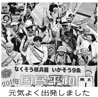
元氣よく出発しました