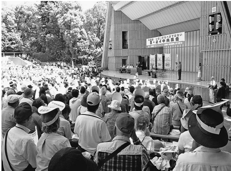
参加者で埋め尽くされた会場の様子

中央集会が開かれました。全国から1500人が結集し、支部からは3人が参加しました。各地で結成されているネットワークからの発言もあり、「10月消費税10%ストップ！」をアピールしました。