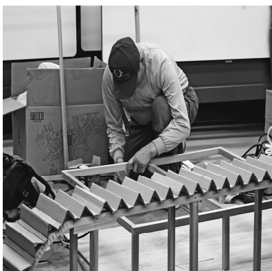
メーデー制作する様子

【荒川川磯部正三記者】ゴールデンウィークのど真ん中の5月2日、息子夫婦と小学生の孫と4人で、自宅から30分ほどのところにある船橋海浜公園（三番瀬）に潮干狩りに行ってきました。ゴールデンウィークということもあり、駐車場は満杯で、仕方なく入り口から300メートル程離れた場所に駐車しました。会場にはいると、砂浜はまるで、原宿の竹下通りのように人で溢れていました。孫娘は潮干狩り初デビューで、砂浜に腕まくりならぬ足まくりをして海を眺めつけていました（笑）。家にあった砂遊び用のスコップでしたが、おおよそ2時間程でバケツが満杯となる大収穫となりました。夕食では収穫したアサリをお味噌汁などにして美味しく頂きました。皆さんもご家族でぜひ行ってみて下さい。