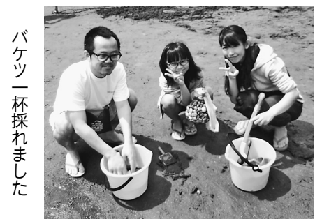
バケツ一杯採れました

【荒川川磯部正三記者】ゴールデンウィークのど真ん中の5月2日、息子夫婦と小学生の孫と4人で、自宅から30分ほどのところにある船橋海浜公園（三番瀬）に潮干狩りに行ってきました。ゴールデンウィークということもあり、駐車場は満杯で、仕方なく入り口から300メートル程離れた場所に駐車しました。会場にはいると、砂浜はまるで、原宿の竹下通りのように人で溢れていました。孫娘は潮干狩り初デビューで、砂浜に腕まくりならぬ足まくりをして海を眺めつけていました（笑）。家にあった砂遊び用のスコップでしたが、おおよそ2時間程でバケツが満杯となる大収穫となりました。夕食では収穫したアサリをお味噌汁などにして美味しく頂きました。皆さんもご家族でぜひ行ってみて下さい。