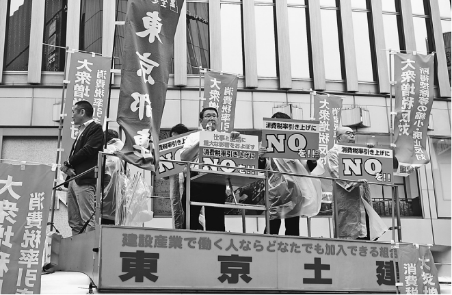
宣伝カーから消費税反対を訴える様子

【町屋南川薄井章記者】5月14日有楽町マリオン前にて、消費税増税中止を求めるキャラバン行動が行われました。