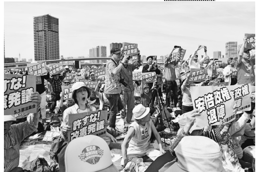
プラカード掲げ改憲反対を訴える様子