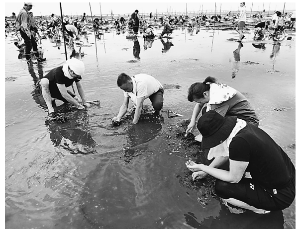
皆さん夢中で探しています

し海ほたる経由で一路潮干狩り会場へ向かいました。潮干狩りトップシーズンと言う事で道のりの渋滞が頭に過ぎりましたが、バスの運転手さんの素早い対応で情報収集して頂いた為、渋滞も回避できてあっという間に潮干狩り会場に到着しました。今までも同じところに行きましたがこんな順調にいった事がありません。あとはメインディッシュのアサリが沢山取れば問題がありません。アサリ会場を見渡すとゴールデンウィーク明けとは思えないほどの賑わいでした。目測ですが数千人はいましたね。私も会場に向かいポイントに到着するまでに周りの取れ具合も確認しましたが、全体的に見てもかなり良い取れ具合でした。後は