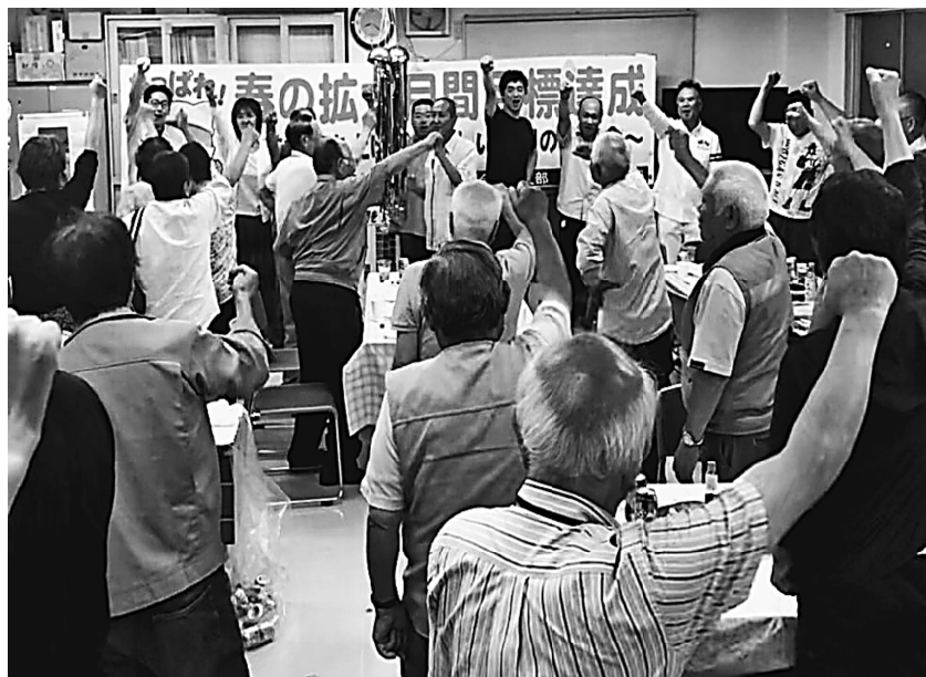
全員で団結ガンパローをする様子

【組織部発】組織増勢、要求実現のために、4、5月と全12日間の拡大行動を設定して取り組みました。荒川支部は1月1日の組織人員の4%の拡大を目指し81人を支部目標として春の拡大月間に取り組みました。4月1日の現勢は1997人と減少