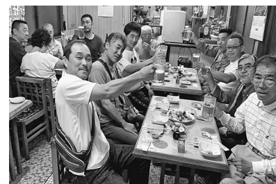
8人の超過達成しました

【東尾久二分会】東尾久二分会は組合内事業所の訪問を続けると、ポツリポツリと成果が挙がりだし後半から一気に加入に繋がりました。終盤は最後まで組合員訪問を続けたことで行動最終日に14人の加入となり、達成することができました。