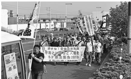
集会後デモ行進する参加者

票が困難な人もいたでしょう。それでも改憲勢力を支持する人たちが、多くの人が棄権をした結果になります。よく若い人たちの間に「投票には興味がない」「政治には失望しているから」と言いつつ棄権をする