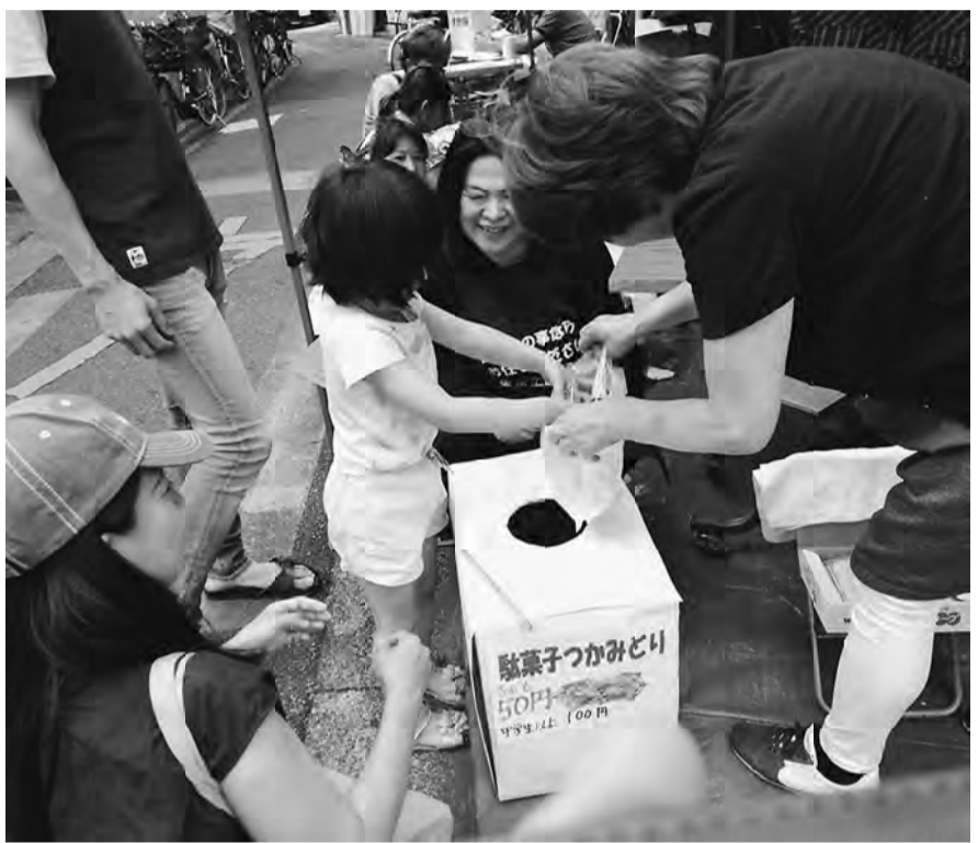
皆楽しく笑顔で対応

【町屋南・薄井章記者】事業所 分会と町屋北分会は合同で荒川支 部会館の下で行いました。 チキンゲット・ワッフル販売 が盛況でお客様に説明しながら楽 しそうに組合員さんが対応をして いました。