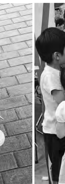
町屋南も日暮里2も子供達に大人気でした

【町屋南・薄井章記者】 子供達が何をやっている のか、興味津々に集まって きてお菓子のつかみ取りや ヨーヨー、竹とんぼ、木工 がとて忙しかったんです。 とても賑やかな住宅デーと なりました。