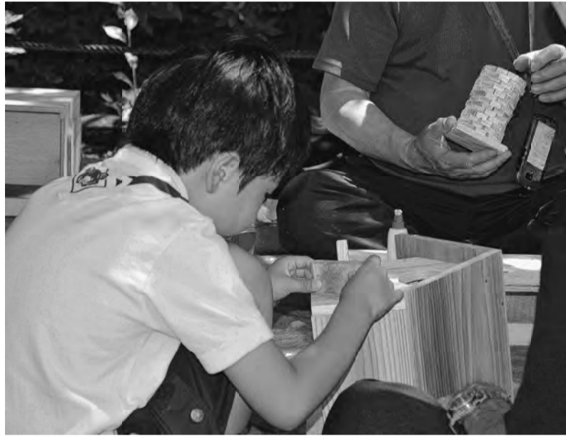
夢中で木工づくりをする子供の様子

【日暮里一 川又好一記 者】今年の日 暮里第一分会 の「春の住宅 デー」は6月 16日(日)に 開催されまし た。