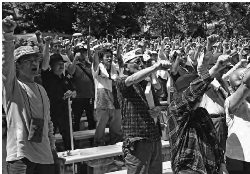
団結してガンバロー参加者の様子