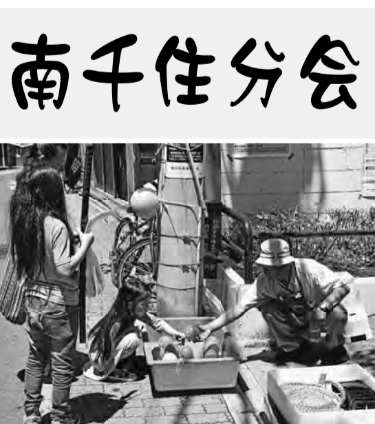
ヨーヨー釣りに子供達が集まりました

参加の分会組合員は事前 に町会にチラシをまき、町会 掲示板に住宅デーポスター を張るなど、開催に向けて 努力を注いで来ました。ま た前週の土・日曜日は地元 のお祭りで、地域の方々へ 無料包丁研ぎなどを、宣伝 していました。