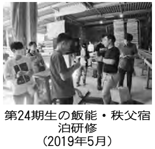
第24期生の飯能・秩父宿泊研修 (2019年5月)

最盛期には3千人もの遊女がいたとされている。「花魁」になるには容姿や気だてばかりではなく、幼い頃からの教育で身につけた詩や音楽、文学などの教養が必要とされ、人気だけではない実力をも兼ね備えた、素養豊かな大スターであった。 花魁がお客から指名を受け、自分の部屋から茶屋へ出向く道中を「花魁道中」といい、秀や新造、妓太