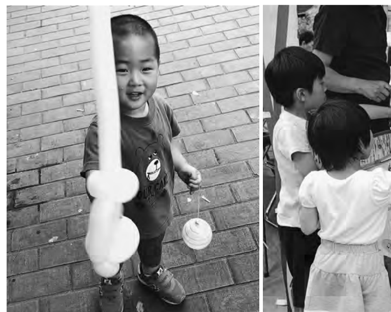
町屋南も日暮里2も子供達に大人気でした

【町屋南・薄井章記者】 日暮里2分会では近隣に住 宅が多く、かなりの人出が ありました。天気にも恵ま れたおかげで、親子連れが 多かったです。