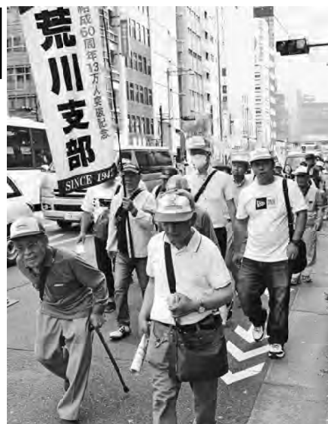
元気よくデモ行進する様子