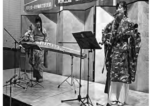
琴・三線の演奏の様子

人生100年時代と言われる現代社会に「医の基本は予防にあり」との信念をもっていた北里柴三郎が新紙幣の顔になるのは偶然ではないだろう。健康で文化的な生活を送るため、また会社を存続させるため、予防医学に本腰を入れる時代になったのは間違いないでしょう。(虎)