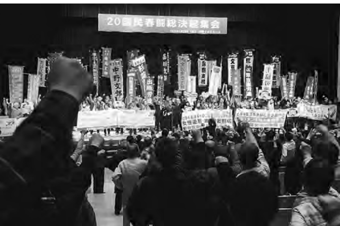
総決起集会 会場の様子

【船橋賢一＝書記局】大いよ春闘がスタートしました。幅賃上げ、全国最賃制度の確立などをめざして、いよ春闘がスタートしました。中野ゼロホールでは1月29日、国民春闘共闘・東京春闘共闘主催の「国民春闘勝利！総決起集会」が開かれました。