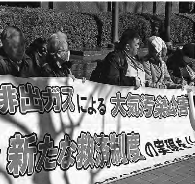
トヨタ本社前で訴える様子

3月から受付開始となります。支部事務所まで申し込み下さい。東京土建の統一観劇日は5月17日(日)となります。昼の部は11:30～となります。 【場所】国立劇場 大劇場 東京・半蔵門 [交通] 【料金】7000円 (一等席) 支部観劇補助対象となります。