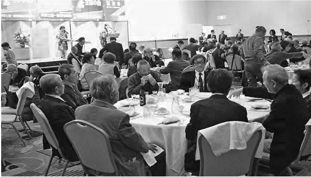
アトラクションの演奏を聴きながら歓談する様子

【荒川川並木義男記者】1月19日、ホテルラングウッド飛翔の間で荒川支部20年新春のつどいを開催しました。当日は70歳を迎えられた組合員やご来賓の皆さまをお招きし、120人の参加となりました。