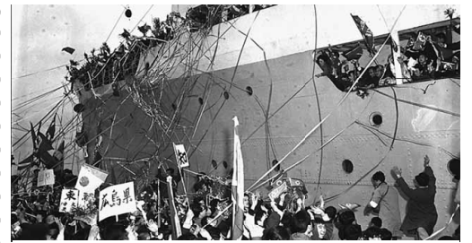
新潟港から清津港へ向かうクリリオン号

府の第二次大戦による東南アジアの占領地と、旧来の植民地朝鮮・台湾との統一的に支配するための方策として、皇民化政策が提唱されました。そのために各民族独自の民族歌・民族旗は禁止され、日本語教育が実施された。神社参拝や天皇崇拝が強制され宮城遥拝が強要されました。