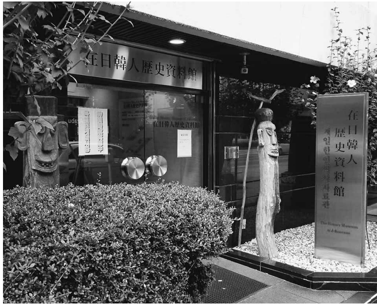
港区南麻布にある在日韓人歴史資料館

府の第二次大戦による東南アジアの占領地と、旧来の植民地朝鮮・台湾との統一的に支配するための方策として、皇民化政策が提唱されました。そのために各民族独自の民族歌・民族旗は禁止され、日本語教育が実施された。神社参拝や天皇崇拝が強制され宮城遥拝が強要されました。