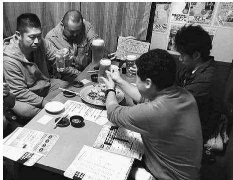
楽しく盛り上がりました

て、当たった人に現金をプレゼントする企画を行い、大変好評でした。初参加の方も含め、「また参加したい」と言っていたら、好評で懇親会を終えることができました。