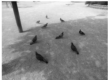
鳩首会談で何を相談しているのかな