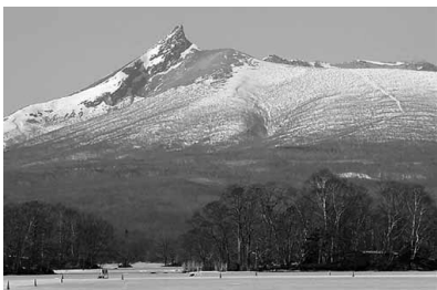
大沼公園から見上げる駒ヶ岳