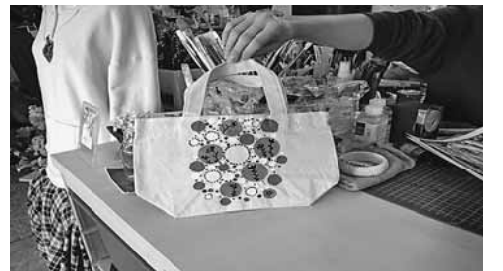
可愛いトートバック