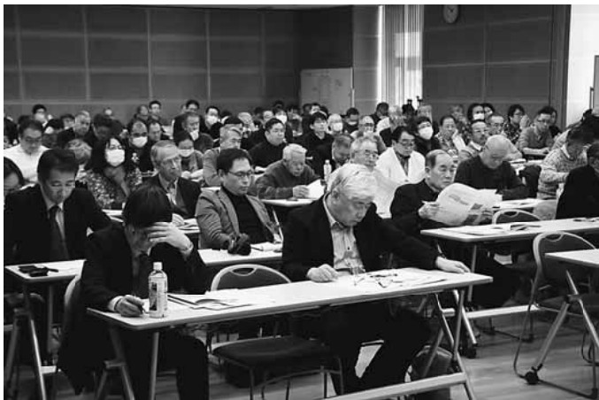
学習討論会の様子

発行所 東京土建一般労働組合荒川支部 東京都荒川区荒川6-3-1 TEL(3892)9131 FAX(3892)9381 発行者・津田宗久/編集長・薄井章 http://www.doken-arakawa.org/