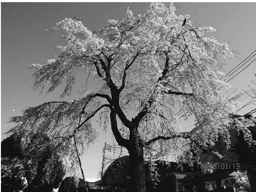
見事な枝垂れ桜がご覧になれます

【町屋南 薄井章記者】 荒川区東尾久3丁目にある 満光寺のしだれ桜が見ごろ を迎えています。 満光寺は天台宗であり、 その創建は南北朝末か室町 時代と伝えられています。 浄土宗寺院としての開山 は智天上人。開祖は、上野 二葉村(台東区)名主二葉 和泉守。上野不忍池付近に あったものが寛永寺の造営 でこの地に移転してきたと 言われています。境内には 永和元(1378)年銘を 始めとする板碑や唐神塔、