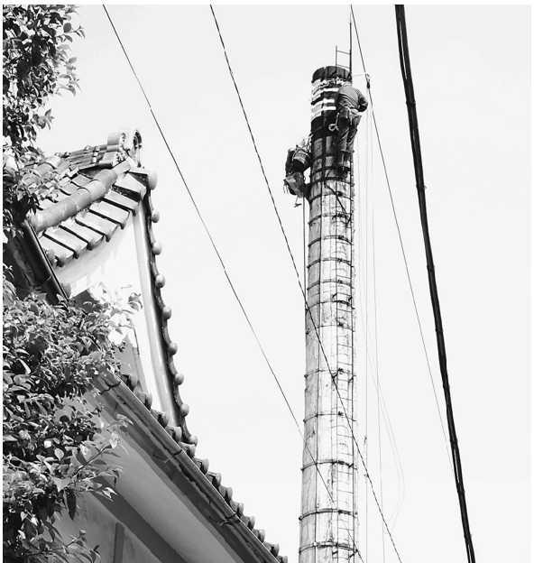
煙突の補強工事をする様子

絵は昔から頼んでいる広告屋にお任せしているそうです。く続けてもらいたいです。ぜひ皆さんも機会があれば行ってみたい下さい。 東京都公衆浴場業生活衛生同業組合（以下浴場組合という）は組合に加盟している約520軒（2019年12月現在）の銭湯にお遍路さん用のスタンプラリー企画を開催しています。 入浴する毎に「巡礼スタンプノート」にスタンプを押してもらいスタンプが貯まったら認定証がもらえます。（軒数の認定です。同じ店のスタンプを複数押すことはできません） 手軽に持ち歩ける便利な銭湯マップもあり、現在はスマホのQRコードを読み込んで手軽にできるようなもなっています。 銭湯好きの方はもちろん普段あまり銭湯に行かない方も、東京散策を楽しみながら銭湯巡りを楽しむことができます。