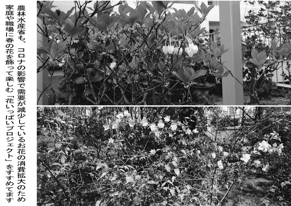
農林水産省も、コロナの影響で需要が減少しているお花の消費拡大のため家庭や職場に春の花を飾って楽しむ「花いっぱいプロジェクト」をすすめています