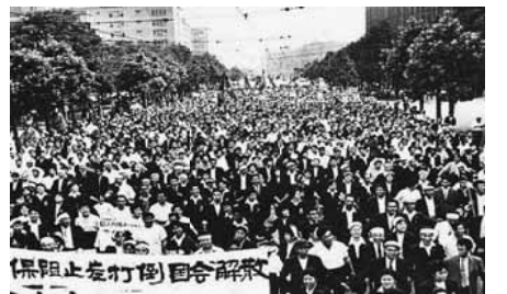
国会に向かうデモの様子

36年「満州国」実業部長として渡満、満州産業開発の責任者として、「満州国」の経済軍事化を推進し、関東軍とも連携し、特に731部隊との関りも中国におけるアヘンの密売も指摘されています。