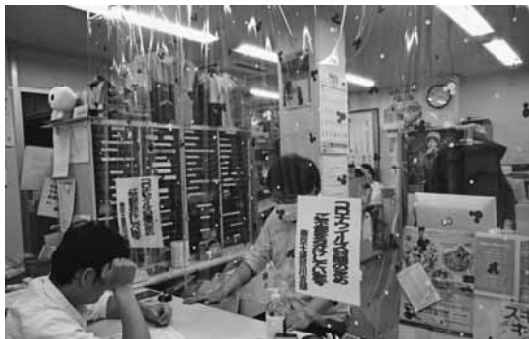
コロナ対策をして窓口相談を受ける様子

これまで例のない困難な拡大への取り組みとなりました。大手ゼネコンを筆頭に相次ぐ現場の中止や延期・受注のキャンセルなどによって事業所の新規採用者の減少、事業所からの独立による労働保険加入の要求や法人設立の相談なども減少し、影響を受けた事も原因となりました。