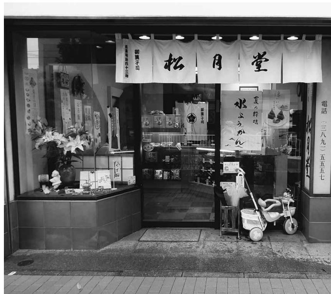
お洒落な正面入り口

そもそも、「松月堂」という屋号は、長崎県佐世保市で創業明治38年の「松月堂カステラ」が日本全国に普及、「松月堂」のネームバリューが全国に知れ渡り、現在、全国に「松月堂」が存在します。