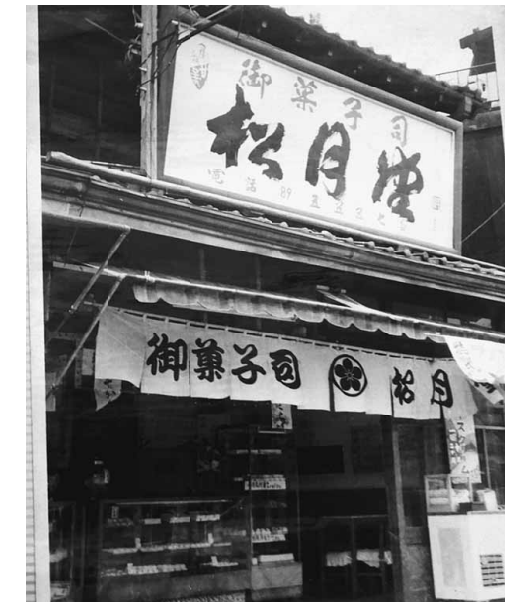
創業時の様子を写真で見せてもらいました