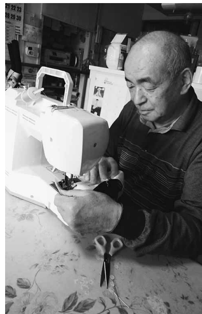
畳屋の手作りマスク作成中

表地は端切れ生地で裏地は三角巾、なれないミシンで縫製しました。息子にはアベノマスクより評判が良いです。コロナウイルスとの戦いはまだ続きそうです。組合員の皆さんも気を付けてお過ごし下さい。