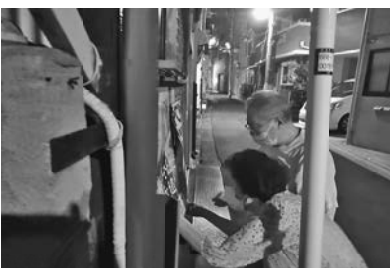
ポスター貼り=日暮里2分会

【書記局】コロナ禍の中、従来のやり方では飲食による接触での感染リスクや3密を回避できない為、参加要請と開催方法について限定し、拡大推進委員会と兼ねて決起集会を行い、意思統一と表彰を行いました。 表彰は第4次行動終了時点で訪問(電話かけ)が多かった分会として西尾久分会(86件)、南千住分会(66件)が表彰されました。続いて10月現勢が1月現勢に対して実増した分会として、荒川分会(+8)、事業所分会(+11)