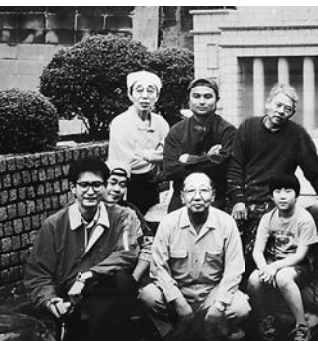
メーデ制作では中心の1人として活躍しました

16年12月12日に浅草寿町1丁目1番地で塗装業の三代目として生まれました。その誕生日の僅か4日前には日本軍真珠湾攻撃の「トラトラトラ！」の号砲が日米開戦の幕開けでした。