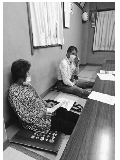
電話掛け=東尾久2分会

後半の取組みでは引き続き、困った仲間の声を拾い上げるために全組合員・事業所に対話(可能な範囲で訪問・群会議・電話・メール・LINE等)を行っています。訪問時には雇用調整助成金や持続化給付金、家賃支援金など申請ができる対象になっていても、申請の方法などがわからず困っている仲間、制度自体を知らない仲間がいなくても徹底して聞き取りましょう。