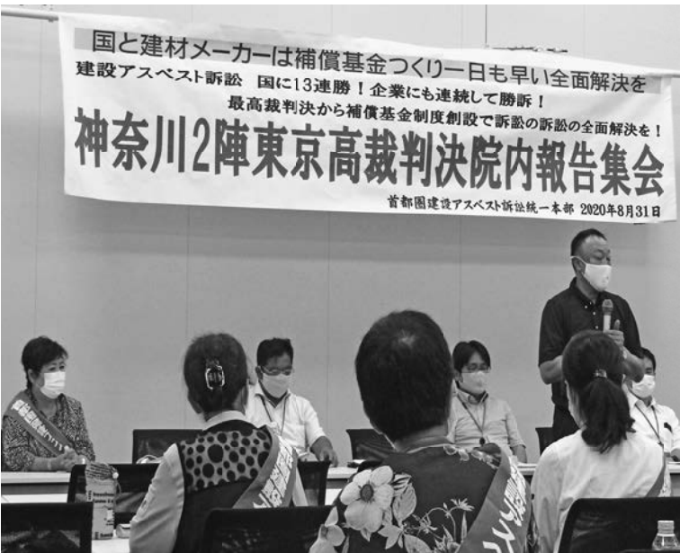
支援集会で早期全面解決を訴える神奈川の仲間

支部からは3人、全体で150人余が参加しました。(株)クボタは、2006年に兵庫県尼崎にある工