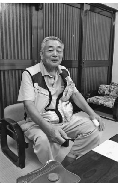
とても助かりました

【日暮里II堀井一記者】新型コロナウイルス感染症拡大により、仕事に大きな影響を受ける事業者の持続の糧として給付される「持続化給付金」。分会の桜田工務店の社長さんも、申請から僅か1週間足らず