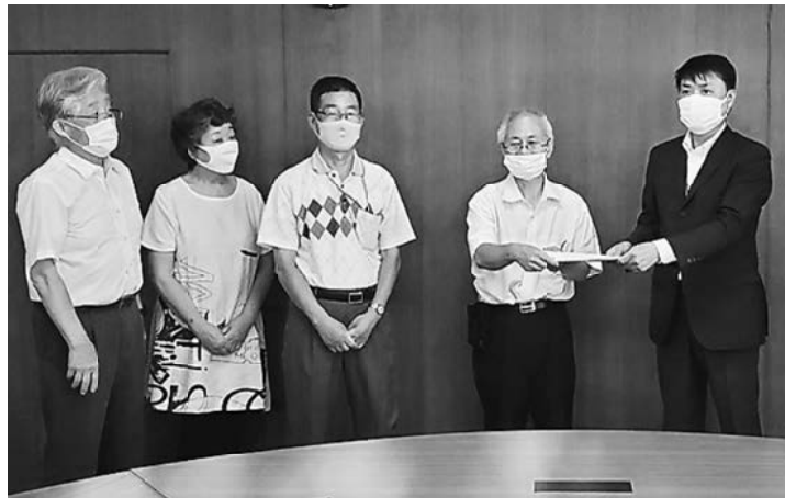
要望書を区に提出する社保協加盟団体

大でも物価は上昇し、区民は困窮していることから区独自の給付金制度を区民全員対象として実施してほしい。今後ますます生活保護申請が増えることが予想される