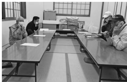
電話掛け=町屋南分会

夫」の激励から、各分会はコロナ禍のなかで自分たちがやれることを話し合い、電話掛け、アポをとってからの訪問、密にならないように拡大行動を心がけて行っています。