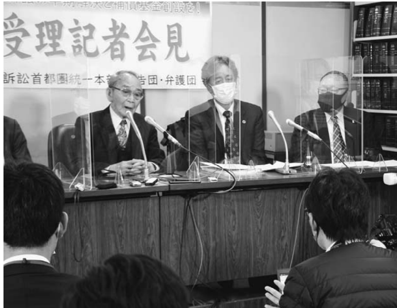
判決を受け記者会見する原告と弁護団