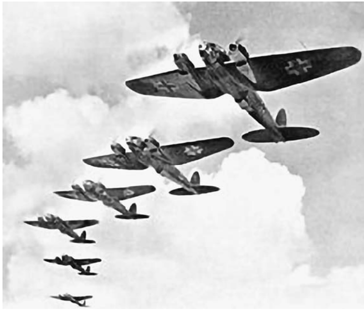
第二次世界大戦 ウィキペディア掲載画像

10月12日、帰国のために牡丹江（ぼたんこ）に集合の命令がソ連軍から下り、1日50キロ、5日間の強行軍が始まった。途中空腹と疲れ、喉の渇きで虚弱な者