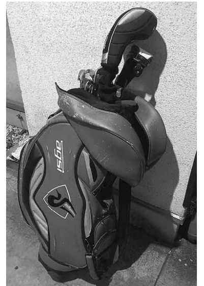
自慢のゴルフ道具は40万円