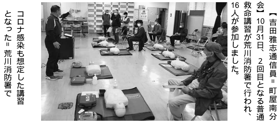
コロナ感染も想定した講習となった「荒川消防署で」