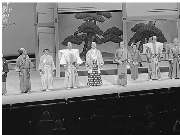
来年の追加公演も決まった『一万石の恋』

映画を締めくくるナレーションで「事故はまだ終わっていない」、その通りだ と感しました。より多くの、みなさんに見て頂きたい映画です。